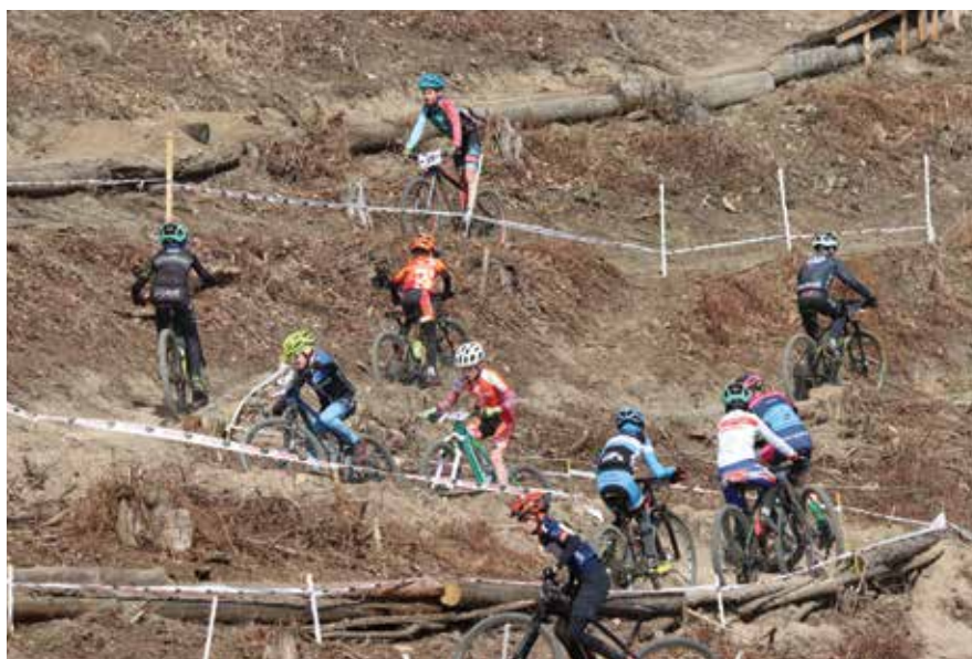
stoupání v závodě