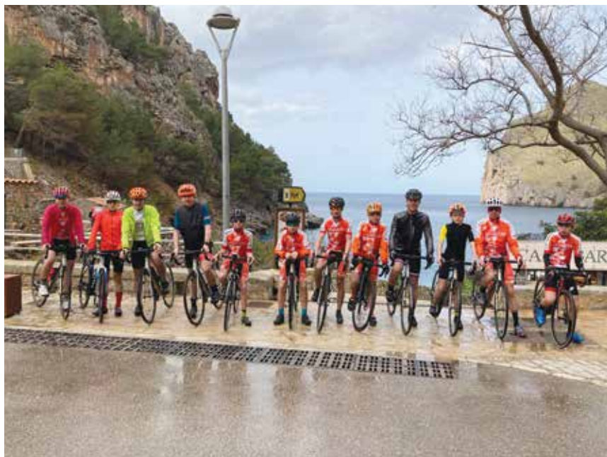
trénink na Mallorce