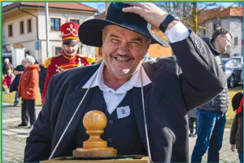
Klecanský masopust – předání „Úřadu“