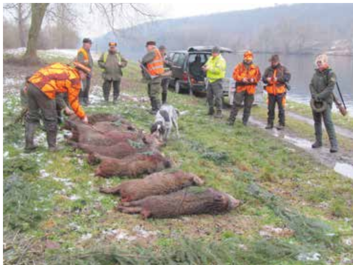
Melancholie u řeky

nému ohrožení turistů, byla požádána o spolupráci Policie ČR, která vyslala na místo konání naháňky hlídku. Její členové uzavřeli jednotlivé leče policejními páskami s upozorněním na zákaz vstupu a osobně hlídali přístupové cesty po dobu trvání každé leče. Obyvatelům se předem dostalo upozornění pomocí rozhlasu a tisku. Mediálně akci zajišťoval štáb České televize, který