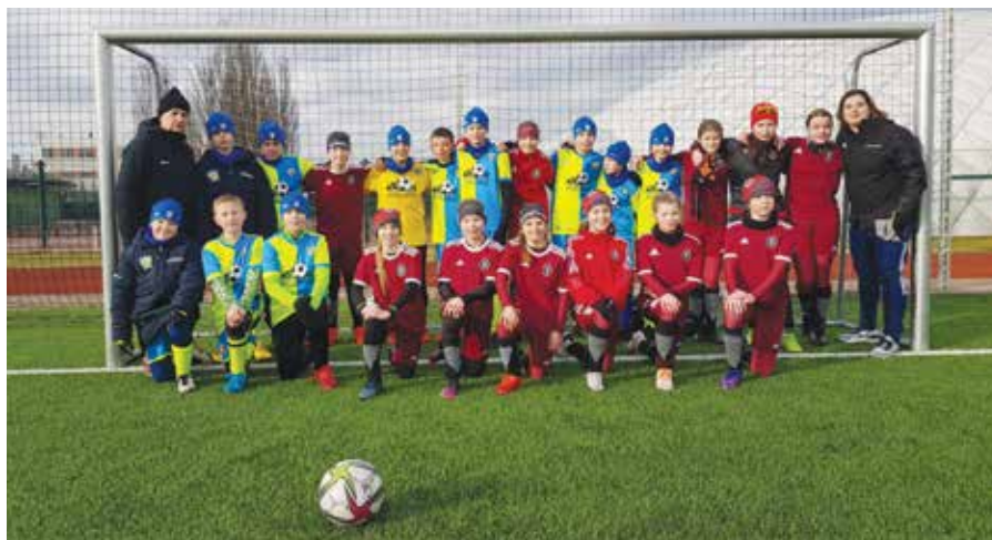
Hráči ročníku 2010 si zahráli přípravný zápas proti dívčímu týmu ze Sparty Praha.

Po vánočním odpočinku se všichni trenéři i hráči našeho fotbalového klubu pustili do pilné práce. Kromě pravidelných tréninků se některá mužstva zúčastnila zimních turnajů a přípravných zápasů. Samozřejmě, že se ani fotbalu nevyhnuly problémy s onemocněními různého charakteru, z nichž nejčastěji to byla některá z variant covidu a s nimi také spojené karantény hráček a hráčů. Ale i tak se toho v lednu stihlo hodně.