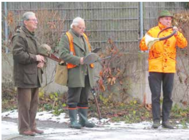
Nástup před klubovnou

Koncem roku 2021 uspořádal Myslivecký spolek Zdiby-Klecany tři naháňky na divoká prasata. První se uskutečnila v neděli 14. listopadu v lokalitě Praha 8 – Bohnice a byla provázena značnou mediální pozorností. Jedná se totiž o oblast využívanou obyvateli Prahy k rekreaci, pěším vycházkám do přírody, či k jízdě na kole, a to především Draháňským údolím. Aby nedošlo k případ-