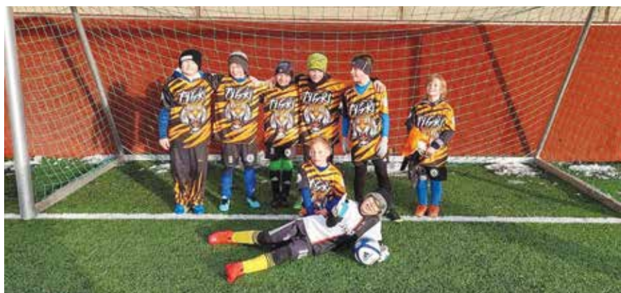
Kluci ročníku 2012 vyhráli turnaj v Praze na Admiře.