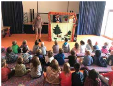
Divadelní představení v aule MŠ

22. 9. se třída Ryba vydala po stopách Šemíka a navštívila Vyšehrad.