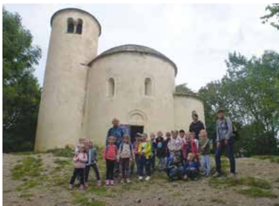
Třída Ryba u Rotundy Sv. Jiří

Předškoláci, „zkušení mazáci“, se hned v září vydali na výlety. 13. září si děti ze tříd Ryba a Kobylka vyšláply na horu Říp.