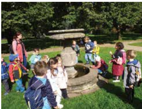
Rybičky na Vyšehradě

Přejeme čtenářům Klecanského zpravodaje krásné podzimní dny.