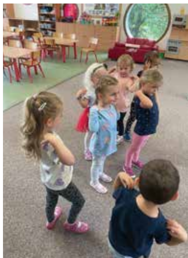
Děti ze třídy Myška

Začátkem září probíhala adaptace nově přijatých dětí. Naši nejmenší navštěvují třídy Myška a Žabka, postupně si zvykají na nový režim.