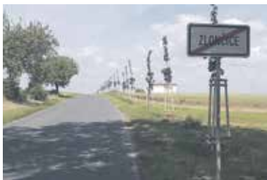
Nově vysazená alej ve Zlončicích.

programů Národního a Operačního programu Životní prostředí. „V regionu Nad Prahou se tak vysadilo skoro 1000 nových stromů, podařilo doplnit nebo obnovit několik alejí. Zlončice, Měsice nebo Nová Ves ve výsadbě pokračují a projekty budou realizovat i v příštím roce. Výsadba stromů bude také významnou součástí pilotního projektu, který má za cíl obnovit historické cesty a propojit tak Prahu s významnými turistickými