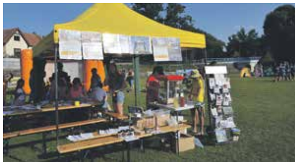
Zastávka Tour mezi řekami 2020 – 2021 ve Vodochodech.

MAS pomáhá se získáním finančních prostředků na výsadbou stromů v rámci dotačních