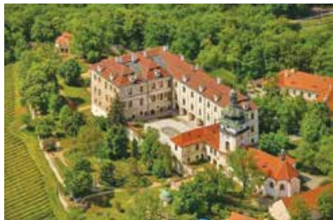
zámek v Benátkách nad Jizerou

Do Benátek nad Jizerou se nejlépe dostaneme autem po rychlostní komunikaci mezi Prahou a Mladou Boleslaví nebo autobusem z Černého mostu.