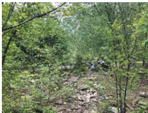
Stav okolí sportovního areálu před zahájením úprav