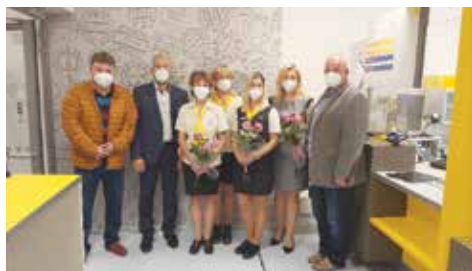
Slavnostní otevření zrekonstruované pošty

Děkuji všem, kteří se na investičních projektech i běžném chodu města podílejí, svým kolegům místostarostům, radním, zastupitelům, zaměstnancům města, členům výborů a komisí a všem ostatním, kteří pracují na dalším rozvoji Klecan.