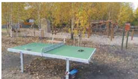
Stav po revitalizaci území