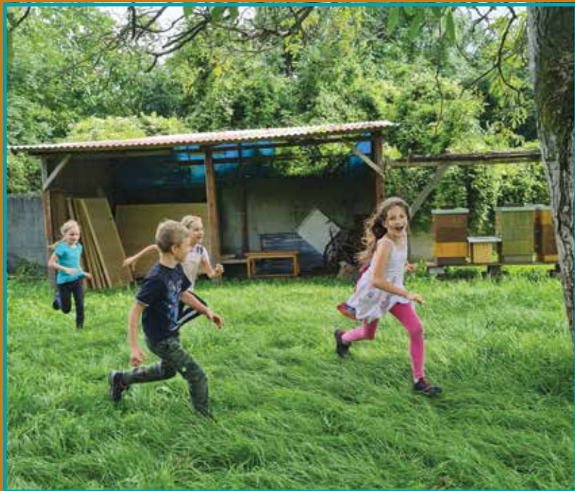
Divoká zahrada v Dolních kasárnách