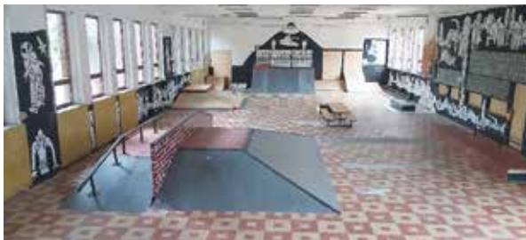
Skate hala z bývalé vojenské jídelny v kasárnách

Na svátek české státnosti 28. 9. 2021 jsme otevřeli skate halu v bývalé vojenské jídelně v kasárnách. Po posouzení budovy statikem zde proběhly drobné úpravy a byly umístěny skate překážky. Část překážek jsme získali darem ze zrušeného skate parku v Praze, část dodala Skate academy a Česká skateboardingová asociace.