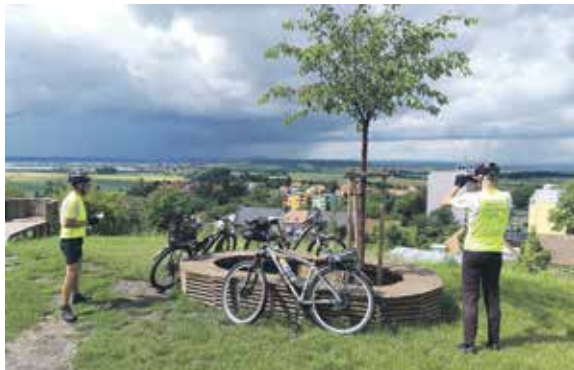
Příprava značení severní cyklotrasy v Odolene Vodě.

ních, příměstských táborů nebo jinou formu systematické činnosti s dětmi a mládeží až po realizaci, obnovu značení turistických tras nebo budování doprovodné infrastruktury, kam patří mobilní aplikace nebo herní prvky, které putování po těchto trasách zpříjemní“, upřes-