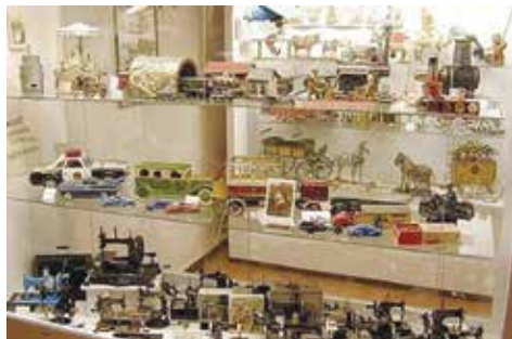
expozice Muzea hraček