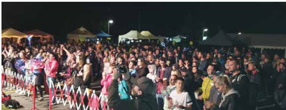
Večerní program byl zakončen koncertem skupiny Fast Food Orchestra a ohňostrojem