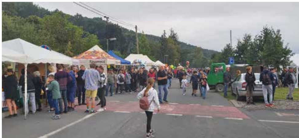
Návštěvníci se mohli občerstvit u některého z mnoha stánků

Přípravy začaly již od časného rána a hodinu po poledni odstartoval hlavní program. Odpoledne a v podvečer probíhal na pódiu festival místních hudebníků různých žánrů, které vyslaly všechny spolupřátelující obce z pravého břehu – Klecany, Zdiby, Máslovice a Řež. Klecany reprezentovaly kapely Older, Kdotořek a rapper JD11 a jeho hosté. Odpoledne proběhl též tradiční