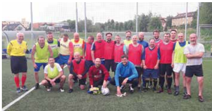
Společné foto týmů Horních a Dolních Klecan, vlevo pan rozhodčí Valtera.

Rozvolnění vládních opatření konečně umožnilo otevřít nové hřiště s umělou trávou i pro veřejnost, zorganizovali jsme na něm fotbalový zápas gentlemanů – veteránů nad 35 let mezi Horní vs. Dolní Klecany (město jsme rozdělili ulicí Československé armády). Utkání řízene rozhodčím FAČR