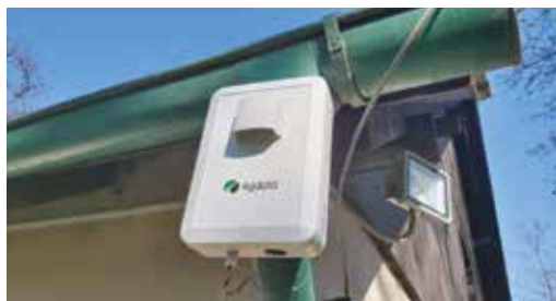
Senzor prachových částic na skautském srubu

Ve městě byly umístěny tři senzory, které budou monitorovat 24 hodin denně míru prašnosti v ovzduší – u skautského srubu, na Vinici a v Klecánkách, tedy v blízkosti místních průmyslových podniků. Aktuální stav prachu v ovzduší najdete na webu města, společně s údaji z meteorostanice umístěné v Klecánkách u přívozu.