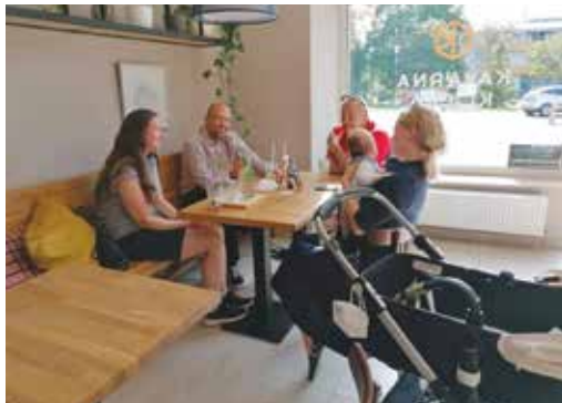
Situace nám konečně umožnila uspořádat setkání s občany v útulné kavárně Klíčka na náměstí

Potěšilo mě i setkání s těmi z Vás, kdo jste si přišli popovídat na náměstí do útulné kavárny Klíčka, kterou jsme s panem místostarostou ve středu 9. června vyměnili za své kanceláře a hovořili tam s Vámi o Vašich starostech, přáních a odpovídali na dotazy. Za postřehy a podněty děkujeme, inspiruje nás to do dalších plánů.