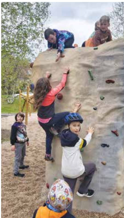
O horolezeckou stěnu je mezi dětmi velký zájem