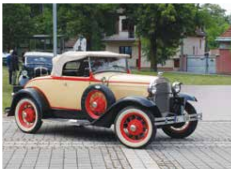
Ford A 1930