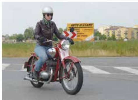
JAWA 350 Perák 1952