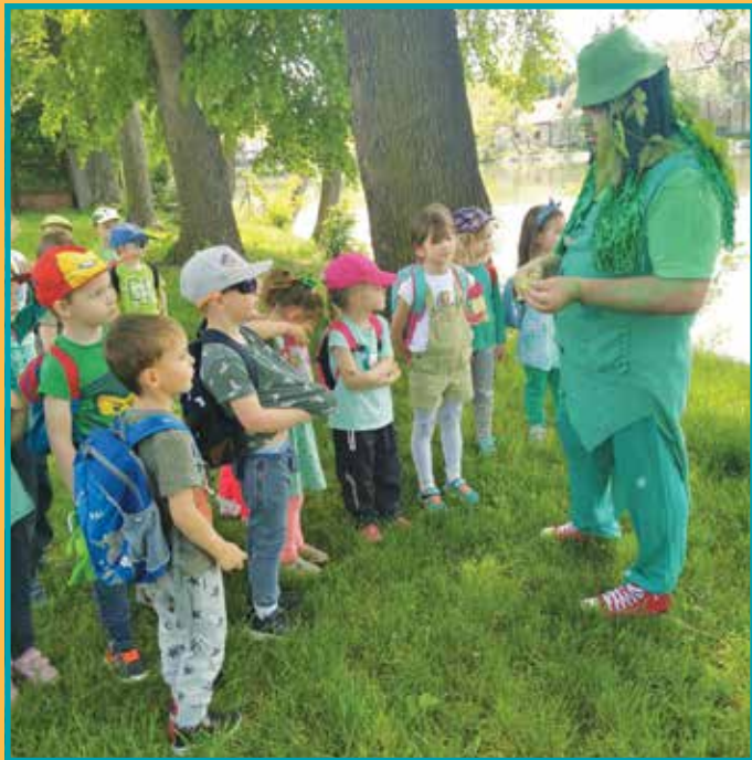
Děti z MŠ Klecany navštívily vodníka u rybníka v Přemyslení