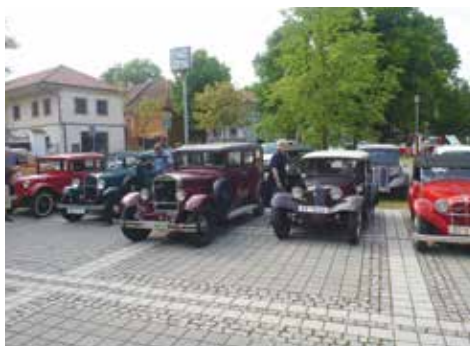
Seřazené vozy na náměstí v Klecanech