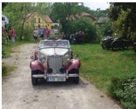
MG TD 1953