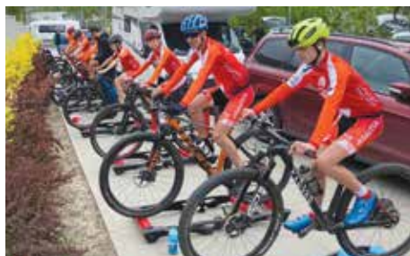
Letka starších žáků a žákyň se rozjíždí před závodem v Polsku