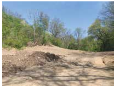
Pozemek po rozšíření ČOV před započítím prací na bikeparku

V současné době je většina pozemků vedena jako „ostatní plocha“ bez jakéhokoliv stupně ochrany (viz také odborná studie „Revitalizace údolí pod Černou skálou“ na webu města Klecany). Zpřístupněním údolí k procházkám nebo vyjížděním obyvatel Klecan nebude způsobena žádná ekologická katastrofa. Naopak, vybudování stezek přispěje k postupnému vyčištění údolí od odpadu na se-