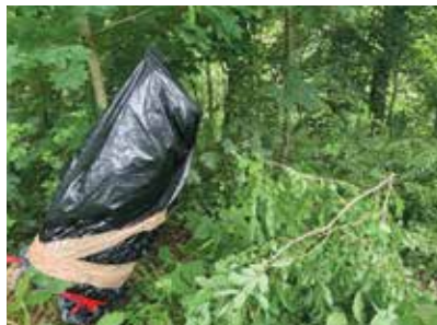
Zapytlování pahýlu akátu

Abychom nezůstali jen u cykloparku a využili potenciál krásného, leč zcela zanedbaného údolí nad ČOV, dohodli jsme se s městem Klecany na zpřístupnění tohoto údolí jak cyklistům, tak pěším prostřednictvím singletrailu/pěšího okruhu na každé straně údolí. Údolí Pod Černou skálou je bohužel z přírodního hlediska od dob komunismu zanedbaná plocha bývalých třeshňových sadů a luk, která zarůstá nekvalitními porosty omezujícími biodiverzitu, v čele s akátem, jehož kořeny vylučují toxické látky, takže v jeho blízkosti kromě černého bezu, kopřivy a vlašovičníků nic neroste. Jen minimální část údolí byla v 50. letech zalesněna.