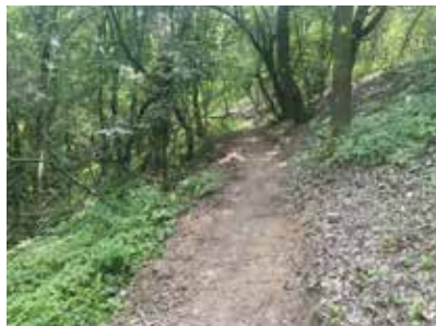
Část vybudované stezky na severních svazích

Asi každý už zaslechl něco o cykloparku nebo chcete-li bikeparku v Klecanech. Je to totiž skvělá zpráva