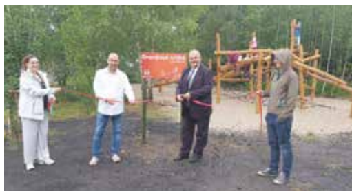
Otevření dětského hřiště

Ve sportovně relaxačním parčíku byly otevřeny další prvky. Již na jaře byla vybudována malá pumptracková dráha, minulý měsíc následovalo umístění boulderové (horolezecké) stěny a balanční sestavy Mikado, na kterou jsme získali finanční dotaci od nadace ČEZ v rámci programu Oranžové hřiště. Hned vedle byly umístěny venkovní nerezové posilovací prvky, takže zde najde zábavu celá rodina. Zájem dětí a mládeže je značný, což mě velmi těší.