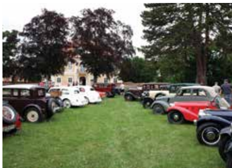
Park Horního Zámku