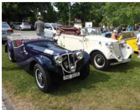
Náměstí Třebízského v Klecanech