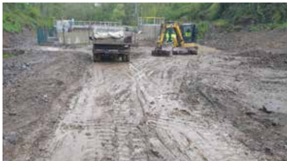
Nevyužitá místo po stavbě ČOV, kde bude pumptrack a bikepark

Po zjištění velkého zájmu o pumptrackovou dráhu jsme přijali nabídku cyklistického oddílu Adastra na spolupráci při vybudování bikeparku s větší přírodní pumptrackovou dráhou. Nacházet se bude na nevyužitých pozemcích za čistírnou odpadních vod. Společně s budováním tohoto cykloparku dojde k zprůchodnění cesty údolím a vyčištění potoka od sedimentů. Dále s oddílem Adastara a komisí stavební a životního prostředí jednáme o vytvoření co nejvhodnější trasy pro cyklisty, aby jejich provoz nekolidoval s budoucí cestou pro pěší a zároveň byl zásah do okolí co nejmenší.