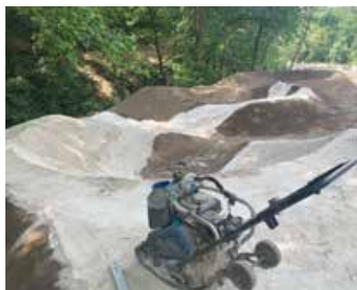
Dokončovací práce na pumptracku

me na jeho výstavbě. Inspirací nám byly nejlepší cykloparky jak z Čech, tak ze zahraničí, kde má nějaký ten svůj „bikepark“ nebo „dirt park“ pro sportovní vyžití mládeže již téměř každá vesnice. U nás se nejedná o žádný areál pro profíky, ale o zábavné sportoviště pro místní cyklisty opravdu každé úrovně. Kromě tradičního a všude oblíbeného cyklistického pumptracku (viz foto), cyklopark obsahuje i 3 linie skoků od nejtěžší se skokovými lavicemi vedoucí podél skal, přes prostřední středně těžkou až po nejjednodušší pro začínající