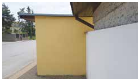
Poničenou zastávku uvedl do původního stavu sám autor

Připojili jsme se k obci Zdíby a společně zorganizovali očkování proti COVID – 19 pro naše občany. Zájem byl veliký, proto budeme pokračovat. Příští očkování se již nebude konat ve zdíbské Sokolovně, ale v Klecanech na náměstí, v bývalé restauraci.