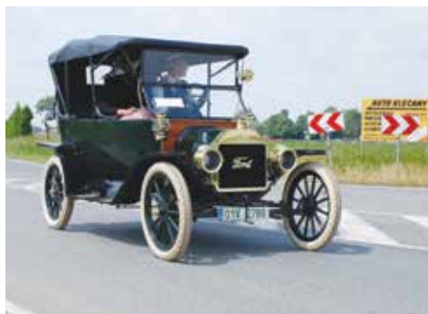
Ford T 1913