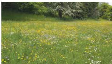
Rozkvetlá luční tráva v Průhonu