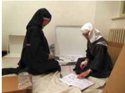
Sestavování skříněk kuchyně v Domě Navštívení