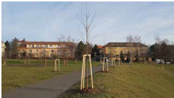
Nově vysazené stromy v budoucím sportovně relaxačním parku

Abych skončil něčím radostným a pozitivním – měl jsem obrovskou radost z vysazení více než 120 stromů a několika stovek keřů do nově vznikajícího sportovně – relaxačního parku v městském sportovním areálu. Mám radost z každého vysa-