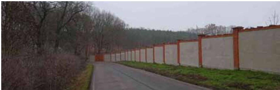
Klauzurní zeď u silnice do Vodochod

V létě a na podzim utichly velké stavební práce na domech, zato pokračovaly úpravy okolí: stavba klauzurní zdi u silnice, plotů u bytového domu, upravovalo se okolí Domu Navštívení, stavěla se nová vjezdová brána.