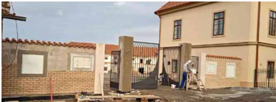
Vstupní brána do areálu