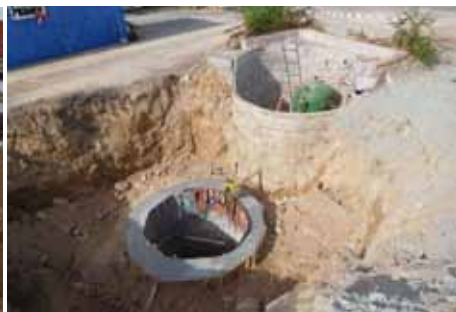
Oprava studny se snížením přístupu