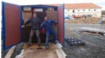
Stěhování z Prahy do Drast