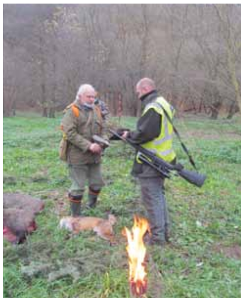
Gratulace střelci lišky