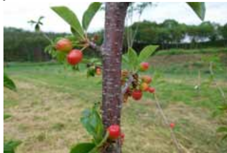
Výsadba kaštanů a ovocného sadu