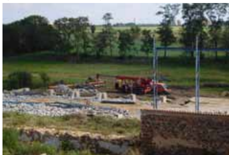
Tzv. „ocelokolna“ a po ní uprázdněný prostor

V říjnu také došlo k dlouho plánované generální opravě studny, jejíž revize se nedělala několik desítek let. Do Drast není přivedena městská voda, a tak celá vesnice má zdroj vody ze studny, která leží uprostřed našeho areálu. Předtím bylo třeba upravit přístup do studny a snížit ho na úroveň, kterou je třeba, aby měl při stavbě kvadratury a kostela. Tu plánujeme zahájit na jaře příštího roku.