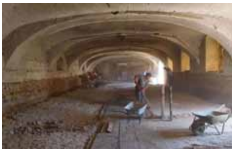
Drátěný plot v lesoparku – brigáda Starých Pák Odstraňování betonu v sýpce – salesiánská brigáda

Byly jsme moc vděčné, že i díky pomoci brigádníků se nám podařilo dát do pořádku první patro jedné ze sýpek tak, aby se tam mohla alespoň o sobotách a nedělích sloužit veřejná mše svatá.