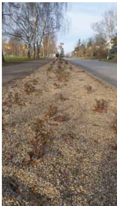
Keřový pás podél ulice Čsl. armády

zeného stromu. Zde vznikla rovnou celá alej podél cesty a další stromy byly vysazeny v okolí. Byl bych rád, kdybychom v podobném duchu pokračovali i na jiných místech ve městě. Tvoříme tak prostředí, ve kterém žijeme, a naším cílem je, aby bylo pro všechny obyvatele co nejpříjemnější a aby se nám tu společně žilo co nejlépe. Následovat by mělo budování volnočasových sportovišť, zejména pro neorganizovaný sport dětí a mládeže, jako skatepark, cyklistická pumptracková dráha, parkourového hřiště, nebo instalace malé boulderové (horolezecké) stěny a další. Zde však narážíme na možnosti našeho rozpočtu, kdy budeme v letošním roce čelit značnému propadu daňových příjmů. O schváleném rozpočtu na rok 2021 a finanční situaci města Vás budu informovat v následujícím čísle Klecanského zpravodaje.