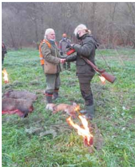
Hospodář gratuluje lovkyni