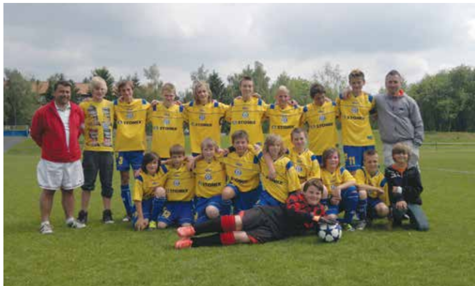
Malá vzpomínka na lepší časy – žákovské mužstvo 2013. Poznáte je?