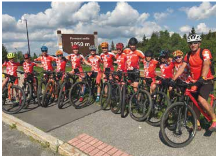
ADASTRA Cycling Team na soustředění před MČR

Závěrem tedy můžeme říci, že to byl možná nejúspěšnější rok v naší historii. Už jenom kvůli spoustě prvozápisů. Např. 3 tituly MČR v jednom roce získaný jedním závodníkem, první titul ze silničních závodů, první medaile z Mistrovství světa, medaile ze závodu světového poháru.