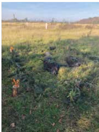
Výřad černé zvěře a srnce