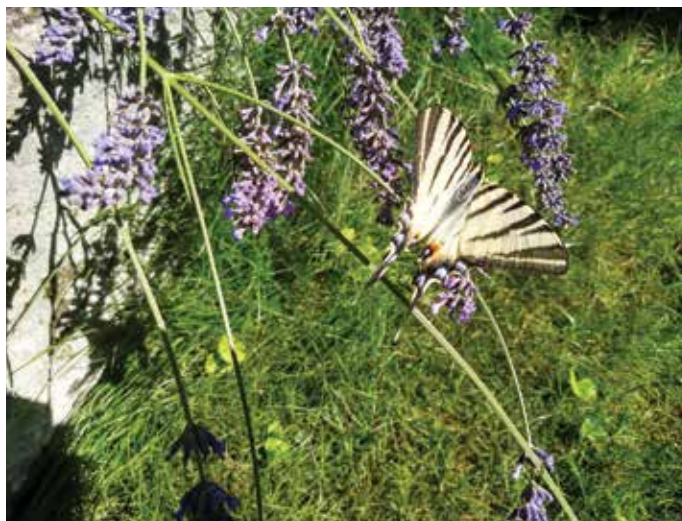
Otakárek ovocný, krásný a dosud žijící klecanský motýl 23. VII. 2019

Bohužel je obecně známo, že v důsledku řady negativních vlivů mnohé druhy živočichů mizí, a navíc jsou často nahrazeny jinými, zavlečenými druhy, které mají někdy působení velmi negativní. Teď si možná řeknete, já přece těm zvířátkům nic nedělám, a ani nevím, co bych pro ně mohl udělat ! Tak