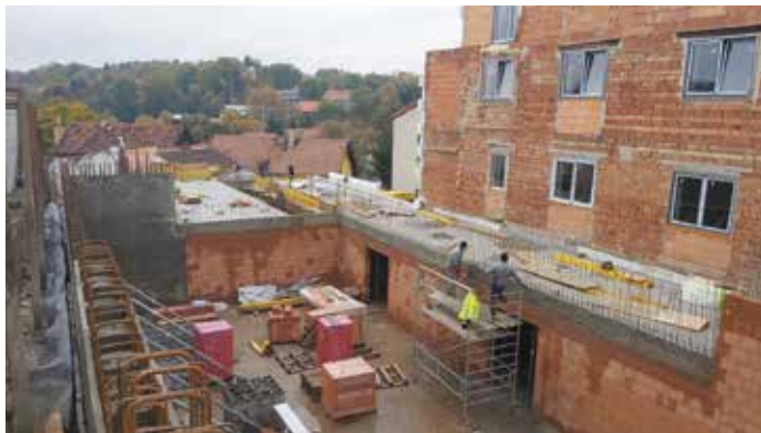
Budoucí společenský sál

zahájena realizace 2. etapy zahrnující rekonstrukci č.p. 487 (únor – březen 2021). Po dokončení stavebních úprav (červenec – srpen 2021) bude obnoven provoz pošty, knihovny a dojde k přestěhování Městské policie do původních prostor. Celkové náklady na přestavbu celého komplexu, ve