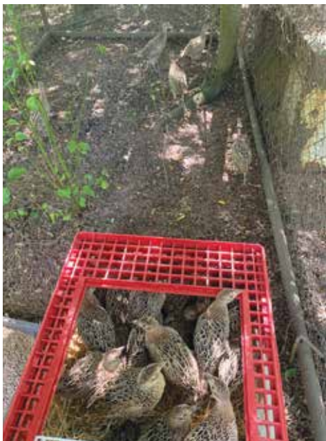
Po převozu u bažantnice

Doba se však změnila. Odchovnu jsme zrušili a bažantí zvěře v přírodě rapidně ubylo v důsledku změněných životních podmínek. Abychom udrželi tuto krásnou zvěř v přírodě, šli jsme cestou