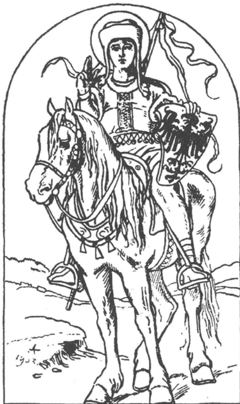
Mikoláš Aleš, Svatý Václav.

Ve Václavově výchově hrála velkou roli jeho babička Ludmila. Je popisována s krásnými vlastnostmi. Kvůli neshodám se snachou Drahomírou se později uchýlila na svůj hrad Tetín, kde byla nakonec zavražděna.