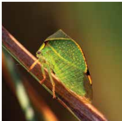
Ostnohřbetka americká, foto A. Něgoda, 14. srpna 2019

Ostnohřbetka americká je dalším z mnoha druhů, které se v důsledku lidské činnosti ze své domoviny dostávají do jiných částí světa. Zdaleka ne všechny tyto druhy je nutno považovat za potenciálně škodlivé, přesto ale – protože v novém životním prostoru většinou nemají žádné přirozené nepřátele – se velmi často stávají výraznými škůdci, se kterými lze jen obtížně bojovat. Nejenže způsobují značné ekonomické škody, ale navíc i vytlačují původní druhy, které jsou dlouhodobě adaptovány v naší přírodě. Množství zavlečených druhů přitom neustále stoupá. Zatímco od počátku 20. století do roku 1910 to bylo pět druhů, což se každou následující dekádu navyšovalo asi o čtyři druhy, po roce 1980 se toto číslo začalo zvyšovat značným tempem. Od roku 2000 do současnosti přibýlo v České republice více nepůvodních druhů, než za celé 20. století. O některých dalších zavlečených druzích, zabydlených v Klecanech, si můžeme říci něco příště.