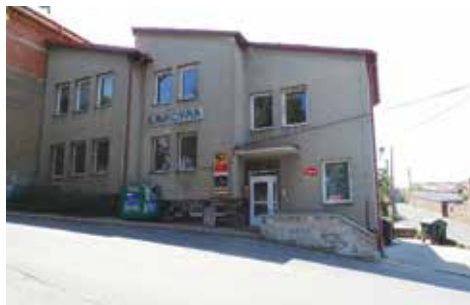
19. 6. 1990 se přestěhovala pošta do budovy městské knihovny