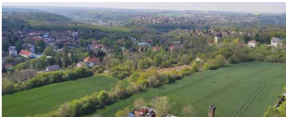
Náměstí a kostel, vpravo zámek, v pozadí Roztoky