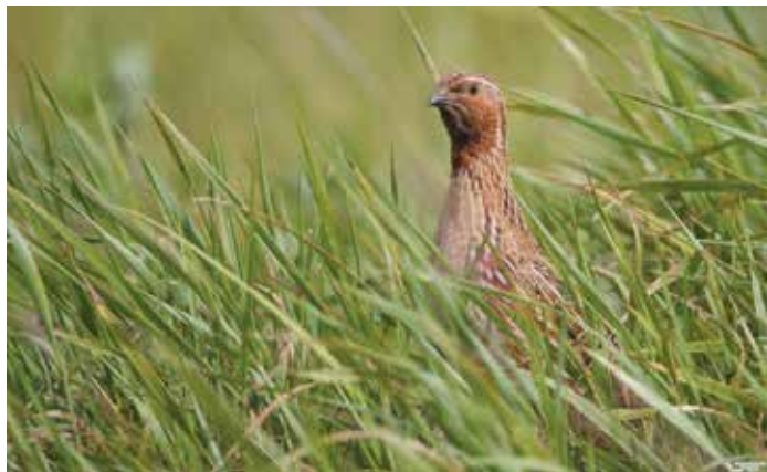
Křepelka polní, foto A. Něgoda, 14. června 1999

Živí se převážně rostlinnou potravou, semeny plevelů a zbytky po žních, v letním období konzumují i hmyz. Hnízdí v červnu až červenci jedenkrát ročně, a to na zemi v malých, dobře zamaskovaných důlčích. Samička snáší