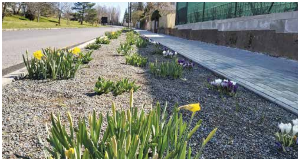
Nový záhon podél ulice Do Klecánek

Ještě jednou bych chtěl moc poděkovat všem, kteří pomáhali a pomáhají. Všem, kteří nám věnovali ochranné pomůcky, šili roušky, nebo dobrovolníkům, kteří pomáhali s rozvozy. Děkuji i Vám, kteří jste se chovali zodpovědně a nedopustili tak větší rozšíření nákazy v našem městě. Dík patří samozřejmě i místostarostům, radním a zaměstnancům městského úřadu, kteří byli nuceni pracovat v neobvyklých podmínkách.