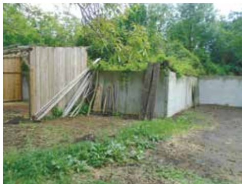
Místo pro úly

Díky dotaci České spořitelny, která nám prostřednictvím Nadace VIA, poskytla dotaci na rozšíření zahrady, jsme pořídili větší kurník a 3 úly pro chov včel. Úly jsou již připravené a čekáme na oddělky z Výzkumného ústavu včelařského v Dole. Připravujeme také místo se stříškou, kam úly umístíme. Se všemi novinkami bychom vás rádi seznámili na společné akci v červnu.