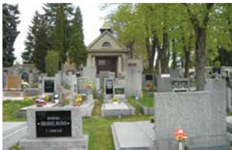
17. 6. 1885 byl vysvěcen nový hřbitov (přední část současného hřbitova)