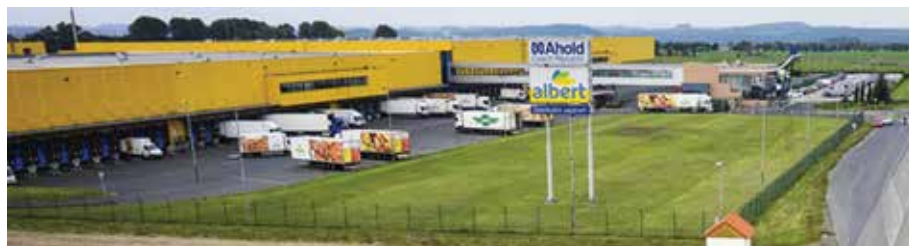
20. 6. 2000 byl položen základní kámen k výstavbě objektu firmy AHOLD CZ