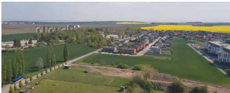
Astrapark, Horní kasárna, Spojářská