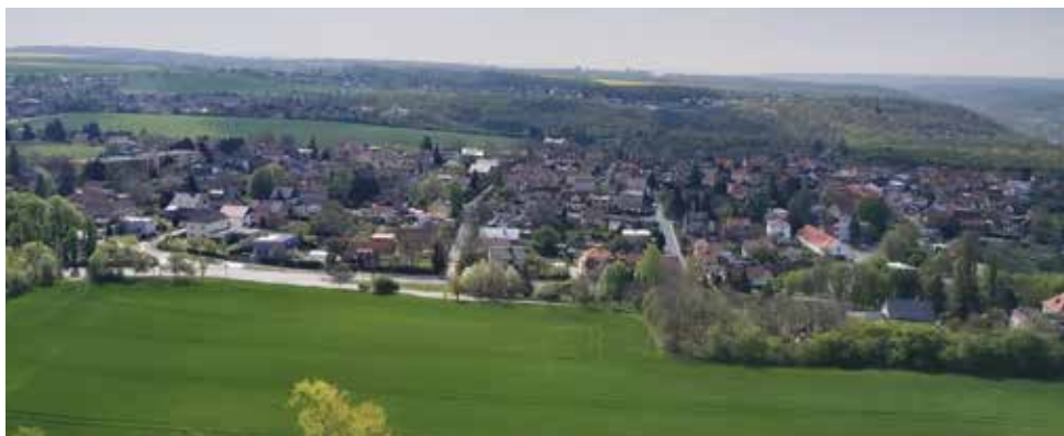
Klecany s Prahou v pozadí