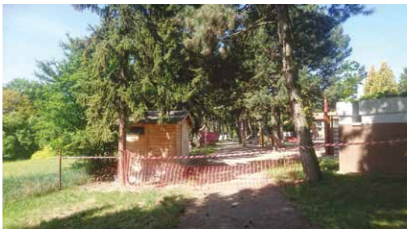
Neveselý pohled na zahradu školky

Je nám hodně líto, že se letos nemohou uskutečnit školy v přírodě, a tak se předškoláci, doufejme, dočkají alespoň důstojného rozloučení se školkou.