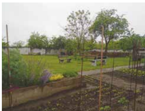
Záhony se zeleninou a bylinkami