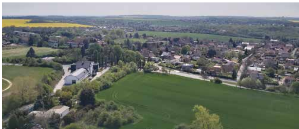
Fotbalové hřiště, hřbitov, Skalky a okolí