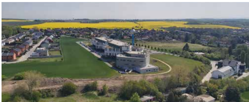
NUDZ a Boleslavka