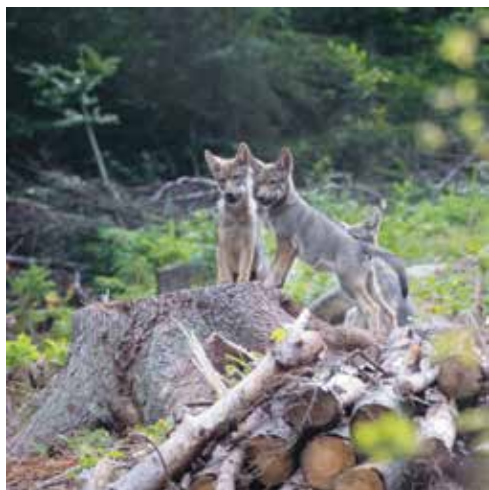
Vlčata – budoucnost smečky

zvěř v MS Bor Machov či daňky v Bernarticích. Je třeba připomenout, že škody na vlky ulovené či zraněné divoké zvěři nejsou státem hrazeny a jdou na úkor myslivců, uživatelů honiteb. Nejzávažnější jsou ale škody, které vlk páchá na hospodářských zvířatech. Dle Agentury ochrany přírody a krajiny ČR bylo v roce 2018 vyplaceno za škody způsobené vlkem 1,5 mil. Kč, v roce 2019 pak již 4 mil. Kč (v této sumě nejsou zohledněny náklady na zabezpečení stád, nemluvě o škodách způsobených zraněným zvířat, ztrátě dojivosti, apod.).