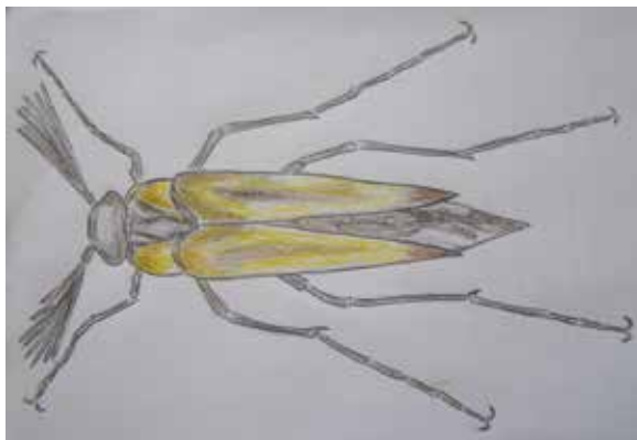
Vějírník nápadný, kresba J. Bratka, 15. března 2020

Mezi živočichy Klecan a Drastů se, vedle relativně běžných, objevují i vyslovené unikáty, jakým je i pozoruhodný brouk žlutooranžově hnědavé až černé barvy, dlouhý cca 9 až 15 mm, pozoruhodné tělesné stavby, a ještě zajímavějšího životního cyklu. Nazývá se vějírník nápadný ( Metoecus paradoxus ), patří do čeledi vějírníkovitých brouků, a z našich obyvatel ho viděl opravdu jen málokdo. Je to dáno jak sporadickým výskytem, tak i jeho tělesným tvarem a barvou. Krovky brouka totiž pokrývají pouze část těla, nikoliv jako u většiny brouků celý zadeček.