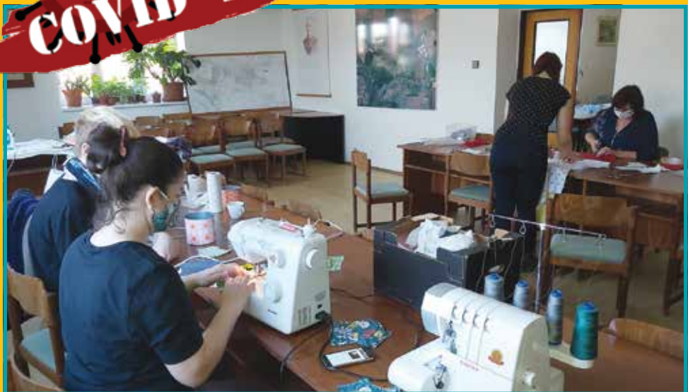
Šití roušek na Městském úřadě v Klecanech