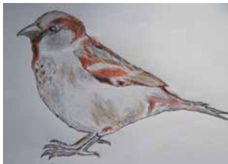
Vrabec domácí, kresba J. Bratka

Vrabec měří obvykle 14 – 15,5 cm, váží do 30 g. Tělo má široké, hlavu velkou, zobák silný. Hřbet má hustě černohnědě čárkovaný, přičemž samec má černou náprsenku na bradě. Šedé temeno je po stranách kaštanové, samice má hlavu šedohnědou.