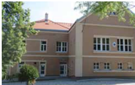
Budova bývalé obecné školy – nyní zdravotní středisko