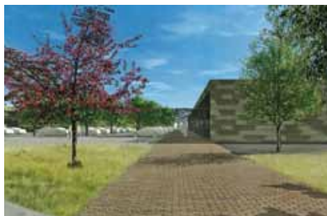
Vizualizace nákupního centra v ulici V Honech