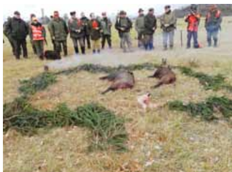
Naháňka 7. 12. Větrušice-Husinec

Šťastný nový rok, mnoho štěstí, zdraví, osobních a pracovních úspěchů přeje