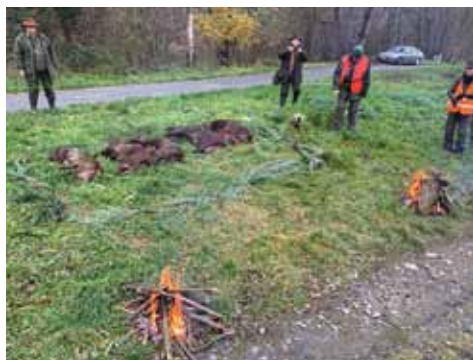
Naháňka 23. 11.