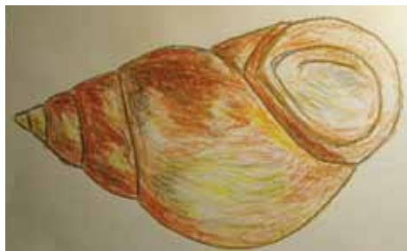
Bahnivka rmutná, kresba J. Bratka, 15. října 2019

Bahnivka rmutná aktuálně není ohrožena vyhynutím, ale její spíše klesající početnost signalizuje nepříznivě změněnou kvalitu vody a stav životního prostředí všeobecně.