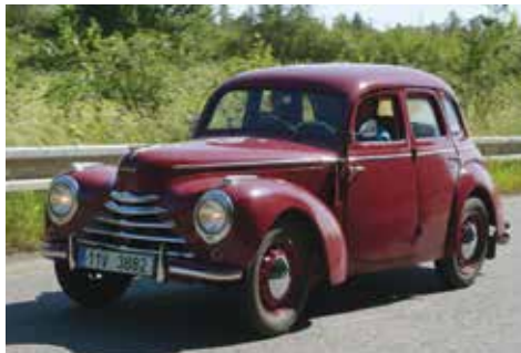
Škoda 1102 p. Šandy vítěze kategorie AUTO

A to jsme se již přiblížili k vyvrcholení večera a k zhodnocení celodenní akce. Čekání na vyhlášení výsledků nám opět pomohl zkrátit svými mistrnými kouzelnickými kousky Vítek Rabiňák, kterému ještě jednou moc děkujeme.