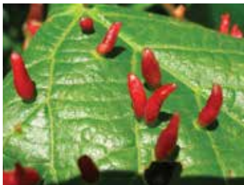
háčky způsobené vlnovníkem lipovým