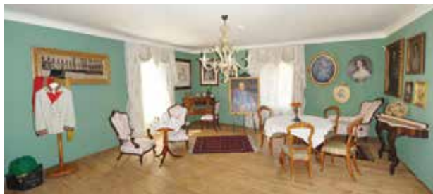
Jeden ze zámeckých salónů