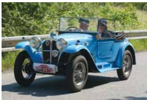
AERO 1000 J. Brünnera

kterého mohli diváci obdivovat bohužel jen na náměstí, protože mu technické problémy nedovolily vyjet na trať. Nováčkem soutěže byl také pan Plachta se svým