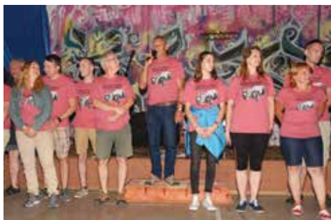
Pořadatelé XXIII. ročníku