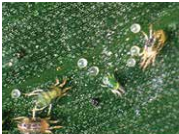
roztoč na okurkách

JH, obrázky zdroj: cs.bestinsectkiller.com a Wikipedie