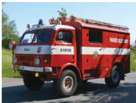
Tatra 805 1958

V letošním roce jsme si připomněli výročí 100 let založení firmy Aero a 90 let od prvního sériově vyrobeného vozu Aero, proto jsme se rozhodli, že oceníme 3 nejlépe umístěné vozy aero. Sjelo se nám jich celkem 11. Nejlépe si vedl pan Smetana s modrou limuzínou Aero 30, který si i v loňském roce odnesl pohár za nejlépe umístěný vůz této značky, na druhém místě skončil pan Dufek s Aero 30 a na třetím místě skončila také třicítka aerovka pana Jeřábka.