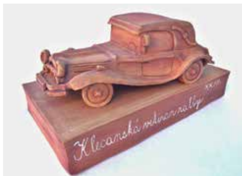
Keramická cena pro vítěze