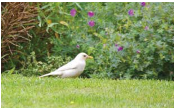
Albín kosa černého v Klecanech, foto Martin Lemon, 18. června 2011

Příroda kolem člověka se mění, a tak už jen málokdo ví, že asi až do poloviny 19. století jsme v Čechách a Evropě měli jednoho velmi plachého lesního ptáka, který se však v průběhu času stal jedním z neobyčejnějších ptáků v lidských sídlech, na vesnicích a ve městech. I v centru největších metropolí tedy můžeme zastihnout kosa černého ( Turdus merula ) z čeledi drozdovitých.