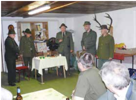
Pasování – úvodní slovo

Pasování na myslivce patří mezi historické slavnostní ceremoniály, při nichž byl vyučený myslivecký mládenec prohlášen za svobodného myslivce. Předcházelo mu nejméně tříleté učení u tzv. mysliveckého principála a následná veřejná zkouška před zkušebními komisaři. Po úspěšné zkoušce byl myslivecký mládenec, po vzoru přijímání mezi rytíře, pasován na myslivce a byly mu předány lovecký tesák, trubka a výuční list, jako doklad kvalifi-