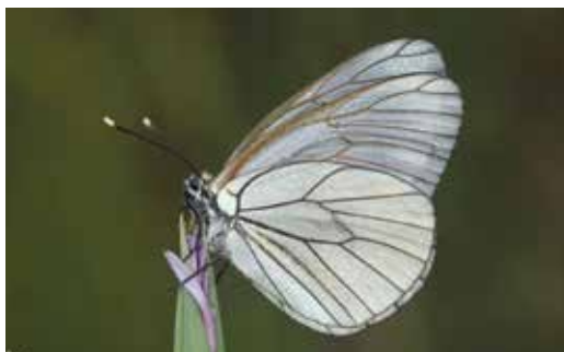
Bělásek ovocný, foto D. Janovský, 15. května 2018

Bělásek ovocný je středně velký motýl s rozpětím křídel okolo 6 až 7,5 cm, přičemž samičky jsou obvykle o něco větší. Křídla jsou bílá