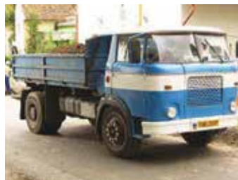
Tatra 138 a Škoda 706 trambus – dva z mnoha nákladních vozů, které jsme dlouhá léta potkávali každodenně v zatáčkách cesty vedoucí z Klecan do Klecánek.