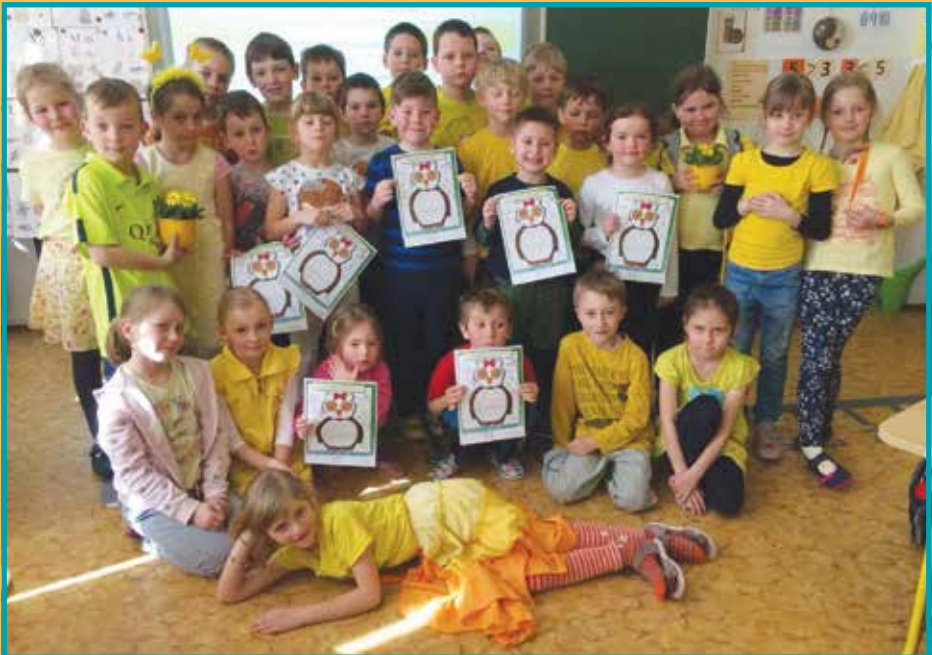
Současní a budoucí žáci ZŠ Klecany