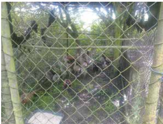
Komorování bažanta před vypouštěním

Jedním ze základů správného mysliveckého chovu zvěře je znalost jejích stavů. Stavů zvěře a jejich přírůstky v honitbě zjišťujeme sčítáním. Způsobů sčítání je celá řada, žádný však není úplně přesný. Úspěšnost a spolehlivost závisí na opakovaném sčítání a na zkušenostech a svědomitosti sčítajících osob. Základním a nejdůležitějším je jarní sčítání, které nám vypovídá o tom, jak zvěř přežila zimní období a jak toto ovlivnilo její kmenové stavy. Zjištěné kmenové stavy se porovnávají s normovanými kmenový-