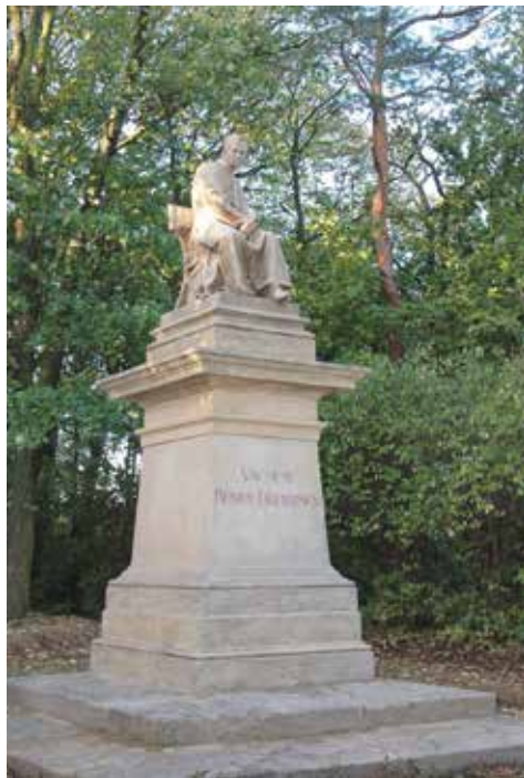
Pomník V. Beneše Třebízského