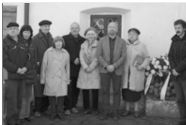
Položení věnce u rodného domku V.B.T. 27.2.2019

Třebízský v Klecanech několik let působil a spolu s Litní a Třebízí tvoří Klecany jakýsi trojúhelník míst, kde si jeho významu velice váží. Dokladem toho je tzv. Rok V. B. T., kdy v Klecanech budou pořádat několik vzdělávacích a vzpomínkových akcí a také zájezd do Třebíze pro širší okruh zájemců z Klecan a okolí při příležitosti výročí úmrtí spisovatele. Termín zájezdu je plánován na sobotu 22. června.