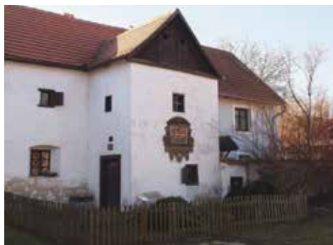
Rodný domek Václava Beneše Třebízského, č. p. 19