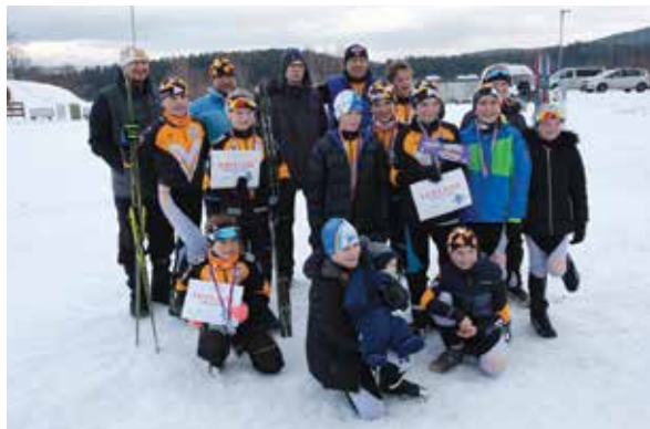
Team Klecan na biatlonových závodech v Liberci

blíž už závodit nebudeme. A hned den na to můžete za námi do Berouna. Velká očekávání máme od všech dětí, rostou ve vyspělé závodníky a podpora zkušenějších kamarádů je žene vpřed. Zkušenost i poznatky z trenérských školení nás posouvají, dávno nejsme jen parta nadšenců, každá sezona je v přípravě uvědomělejší. Teď nás můžete potkat nejen v kasárnách, ale i při nabíhání „objemů“ v okolí, na schodech u kostela, v kopcích v háji.