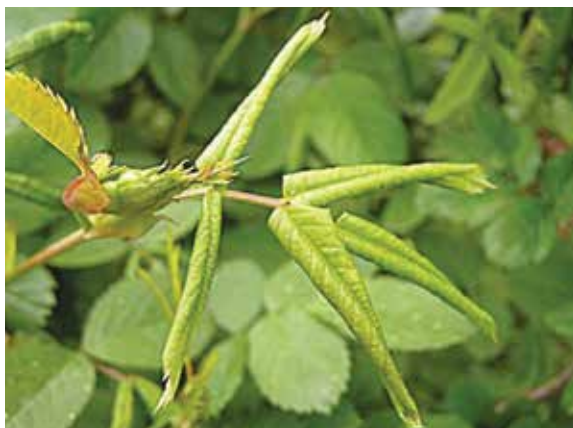
napadené listy růže