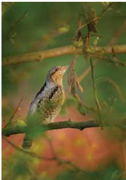
Krutihlav obecný, foto Tomáš Skorupka, 2. května 2015

Tento zajímavý datel se vyskytuje ve větší části Evropy, vyjma jižního Španělska, jižního Balkánu, Irska, Skotska a severní Skandinávie. Směrem k východu jeho teri-