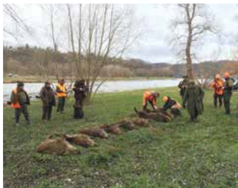
Naháňka 5. 1. 2019