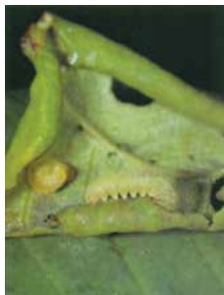
housenice pilatky drobné