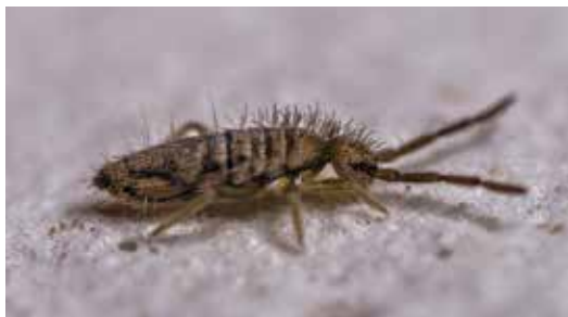
Huňatka sněžní, foto D. Janovský, 10. února 2018

U nás v Klecanech není huňatka příliš běžná, pravděpodobně proto, že většina zdejších lesů není původních. To, čím byly kdysi Klecany významné, byly ovocné sady, místy i pastviny. V důsledku změn v hospodaření však sady téměř vymizely, a na většině míst jsou dnes křoviny nebo vysazené, druhotné lesy. Přesto byly huňatky v počtu několika desítek jedinců pozorovány ve svahovém lese v „Šulkovně“ nad Klecánkami, a několik exemplářů bylo viděno v Klecanském háji. Podle poznatků z jiných částí republiky se během některých zim huňatky objevují na sněhu i masově v desítkách tisíc jedinců, takže si jich všimnou i náhodní pozorovatelé. A není třeba tyto malé tvory litovat, že by jim snad mohla být zima. Jim se na sněhu opravdu líbí!