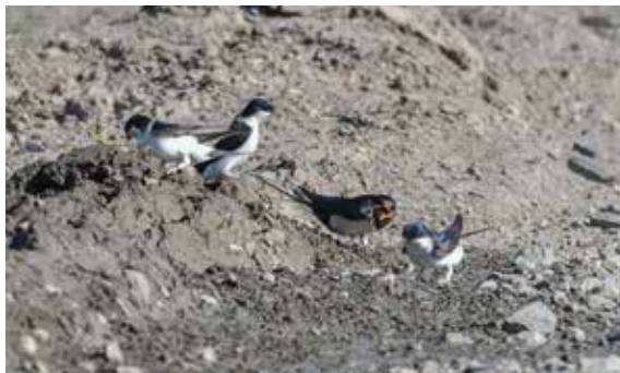
Jiříčky a vlaštovky při odběru bahna na stavby hnízd, autor snímku Jiří Brázda, 21. května 2018

Blíží se podzim, a s ním přichází doba, kterou lidé dříve znali jako běžnou událost, ale dnes si o ní obvykle čtou jen děti v barevných knížkách nebo na internetu. Odlétají vlaštovky a jiříčky! Ptáci, kteří kdysi po stovkách a tisících sedávali na drátech elektrického vedení, aby se před odletem do vzdálené Afriky zfor-