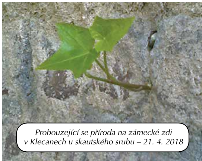
Probouzející se příroda na zámecké zdi v Klecanech u skautského srubu – 21. 4. 2018

Muzea kromě stálých expozic nabízejí krátkodobé výstavy, komentované prohlídky nebo přednášky. Vstupné je, na současné poměry, téměř zanedbatelné, zato informace a vědomosti, které získáme budou k nezaplacení. Nezapomínejme proto při svých výletech na tyto, unikátními exponáty naplněné, většinou historické budovy, které najdeme téměř v každém větším městě. V obcích a menších městech pak máme možnost navštívit řadu soukromých muzeí, která v poslední době rostou jako houby po dešti.