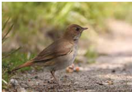
Slavík obecný, autor snímku Tomáš Skorupka, 28. června 2016

Je malý a nenápadného vzhledu, avšak s vynikajícím hlasovým fondem. Protože zpívá především v noci, stal se poetickým symbolem jarních nocí, v nichž inspiruje jak básníky k tepání veršů, tak milence k lásce. Uhádli jste, že se jedná o slavíka obecného ( Luscinia megarhynchos ) z čeledi drozdovitých. Vyskytuje se ve střední a jižní Evropě, v severní Africe (Maroko, Alžír, Tunis), v Malé Asii a na Kavkaze, a dále k východu až do střední Asie (Kazachstan, Kyrgyzie). U nás v Klecanech hnízdí na několika místech, například v těsné blízkosti lomu a v mokřině u bývalé vodárny.