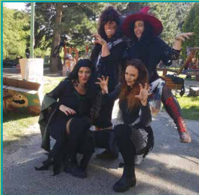
Čarodějnice ze školky