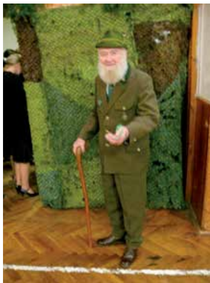
Hajný dbá na dodržování tradic