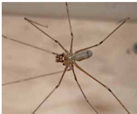
Třesavka velká, 17. 8. 2009

takže máte-li doma třesavky, po čase vymizí odvěcí pavoučí obyvatelé domácností, jako jsou pokoutníci, temnomil sklepní a další. Třesavky loví i komáry, mouchy domácí, rybenky, moly a jiné živočichy. Když se nešťastná kořist zaplete do málo viditelných vláken, třesavka ji obratně a bez kontaktu s tělem kořisti nejdříve pevně obalí pavučinou, pak jí prokousne kutikulu (pevnou pokožku) a napumpuje do ní trávicí šťávy na bázi proteináz, amyláz, lipáz a karboxypolypeptidáz. Jako většina pavouků, tak i třesavky využívají tzv. mimotělní trávení, kdy dochází k tomu, že trávicí fermenty zcela rozloží vnitřní tělo oběti. Obsah pak pavouk vysaje, a z kořisti zůstane jen povrchová „slupka“.