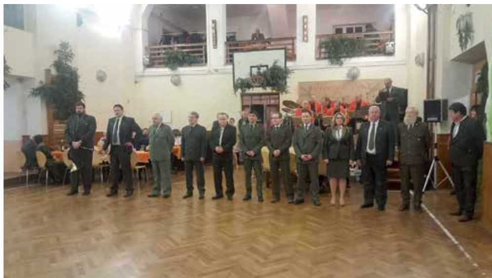
Nástup s trubači