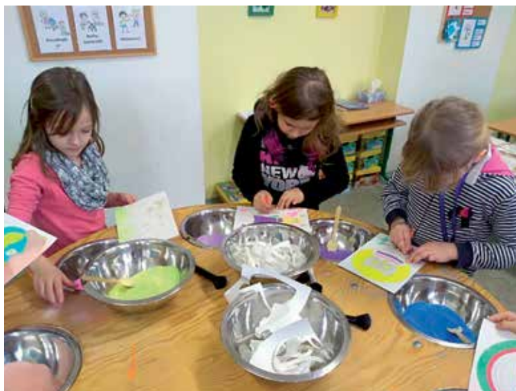
Děti z družky

Závěr měsíce patřil dvoudenní výtvarné dílně s názvem „Tvoříme pískem“. Pískové obrázky byly pro nás úžasnou zábavou a rády bychom si to opět někdy zopakovaly.