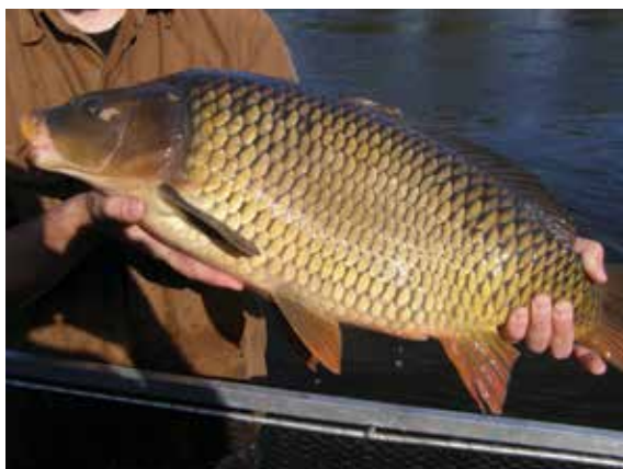
Kapr obecný «squamatus», foto J. Bratka, 7. X. 2009

Šlechtění a dobře živení kapři dosahují často velkých rozměrů a hmotnosti, a jsou to spíše takové vodní vepřiči, vysokí až 40 cm a dlouzí až 120 cm, s váhou přes 20 kg. Ale uloveni byli i jedinci s váhou až 32 kg. Kapr obecný ve své původní podobě vypadá však poněkud jinak, než naducaný šupináč z Třeboně. Mnozí ctitelé vánočních kaprů by ho možná ani nepoznali. Je torpédovitého tvaru, rychlý a mrštný, o výšce do 25 cm a délce do 70 cm. Původní domovinou