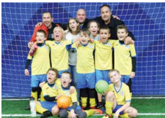
V silné konkurenci pražských týmů obsadili klecaňští fotbalisté v kategorii U8 sedmé místo. Díky kluci a bojujeme dál!