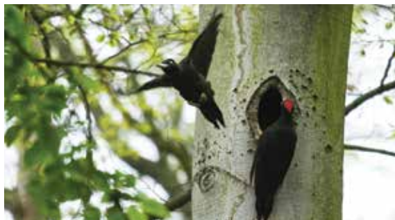
Datlové černí u hnízda, autor snímku Jiří Brázda, 2. května 2017

Při procházení Klecanským hájem často uslyšíte zvonivé -kli-kli-kli-kli- , doplněné následným dlouhým -tíííík- . Jedná se o ptáka, který co do zvuků dává o sobě vědět velmi hlasitě, ale pozorovat ho na stromě již tak snadné není, ač je velký téměř jako vrána. Je to datel černý ( Dryocopus martius ). Dalším signálem jeho přítomnosti pak je intenzivní bušení do dřeva, avšak s poněkud pomalejší frekvencí, než ji mají např. strakapoudi či jiní datlové.