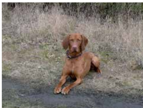
Bajk v poloze daun