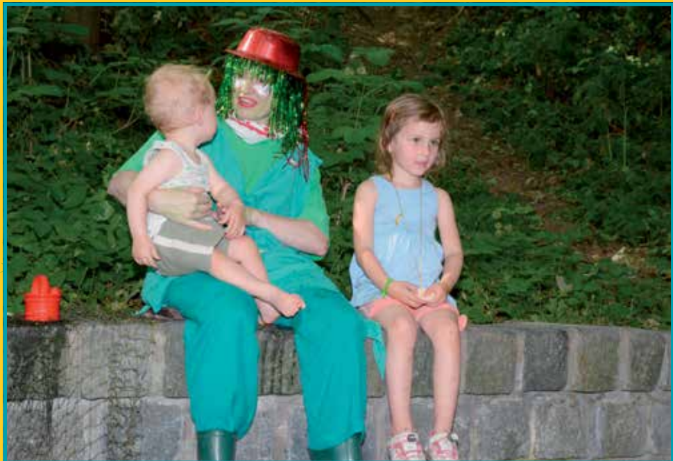
Pohádkový les v Klecanském háji