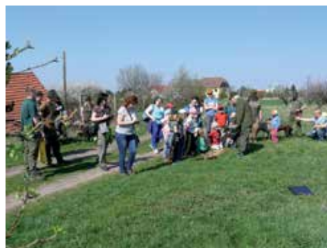
Procházka s myslivci

myslivosti, kdy se v přírodě rodí nejvíce mláďat. Také připomenul zásady správného chování například při nalezení takzvaně opuštěného mláděte či při setkání s černou zvěří. Děti se ptaly na vše, co je zajímalo, a dá se říci, že se dozvěděly mnoho novinek.