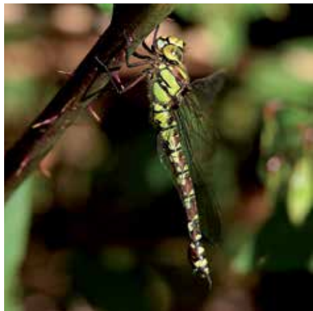
Šídlo modré, samička, 24. 3. 2017

Je měsíc nejbujnějšího růstu rostlin a rozvoje fauny, proto se poohlédneme po jednom tvorovi, který nás může potěšit právě v období mezi koncem června až začátkem září, ale při hodně dobrém počasí jej lze pozorovat až do poloviny listopadu. Je to skvělý letec, kterému se co do manévrovacích schopností nevyrovná žádné letadlo a vznášedlo, ba ani helikoptéra. Tyto stroje by totiž musely umět v plné rychlosti zahýbat doleva i doprava, nahoru i dolů v pravém úhlu, stát na místě, létat pozpátku, a to vše rychlostí min. kolem 15 m/sec.