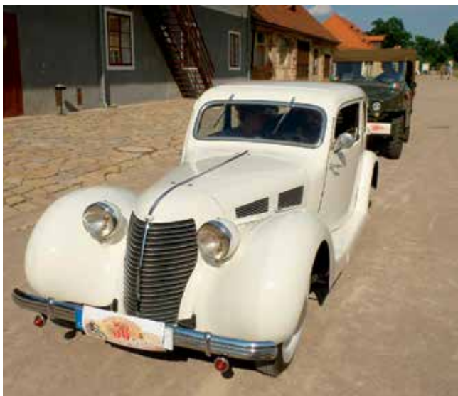
AERO 30 1938