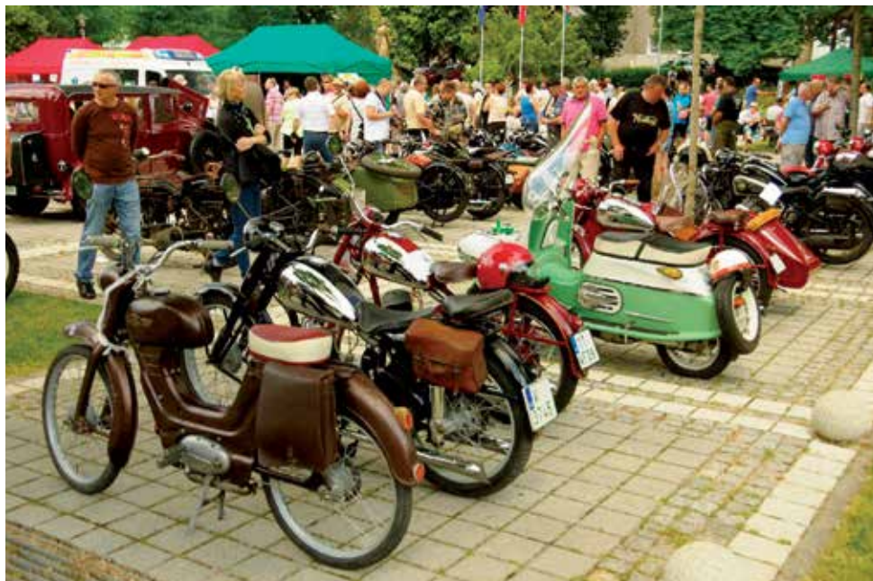
Veteran rallye 2017

Druhá červnová sobota je v našem městě již jednadvacet let spojována s motoristickým kláním Klecanské veteran rallye a zároveň v kalendáři veteránských akcí vyhledávaným termínem milovníků staříčkových aut a motorek. Řada účastníků si podle tohoto termínu plánuje dovolené i začátek veteránské sezony.