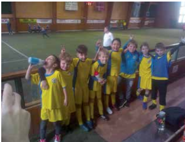
Halový turnaj Milovice

3. + 2. + 2. + 2. + 2. + 2. = 1. To není rovnice poblázněného matematika ani potvrzení, že fotbal nemá logiku, ale naopak součet našich umístění na stupních vítězů z jarních částí turnajů a z nich plynoucí celkové 1. místo při závěrečném ceremoniálu na turnaji v Radošovicích s náskokem 7 bodů před Dobřejovicemi! Naše jarní 6 členná skupina nebyla vůbec jednoduchá. Se vsí zodpovědností odehráli všichni všechny turnaje, byť počasí kolikrát nepřálo.