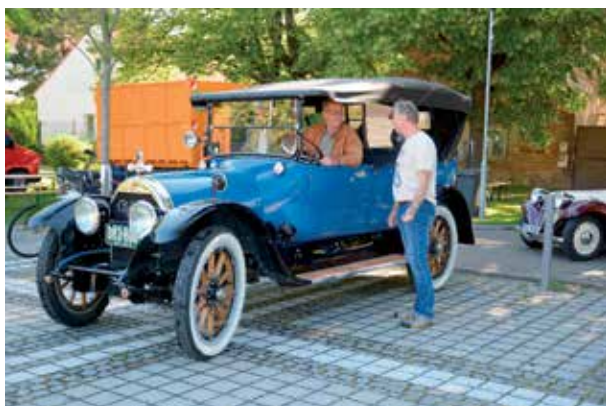
Cadillac 55 1917

I v letošním roce se 10. června naše malé náměstí zaplnilo během dopoledne celou plejádou staříčkových aut a motocyklů, mezi kterými se projížděly staré kočárky a korzovaly posádky v dobových kostýmech. V deset hodin již bylo náměstí zcela zaplněné nejen přihlášenými vozidly, ale i těmi, které jejich majitelé přivezli jen na výstavu. Všechna vozidla, která byla do soutěže přihlášená, musela splnit podmín-