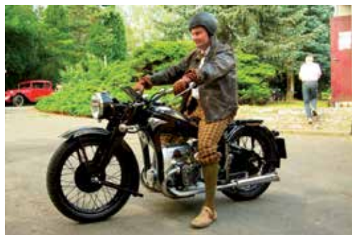
Zundapp 500 1936