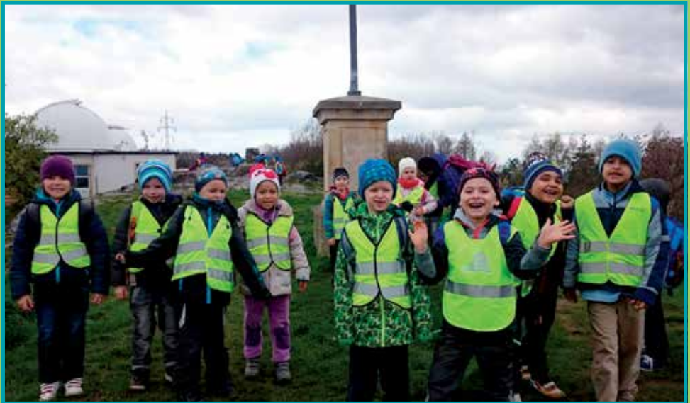
Děti z MŠ Klecany u hvězdárny v Ďáblicích