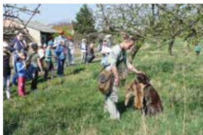
Dárek předává lišku

Letos nebyli k vidění lovečtí dravci, zato se nám podařilo soustředit 5 psů různých loveckých plemen. Děti se tak mohly seznámit s německým krátkosrstým ohařem, českým fouskem, anglickým kokršpanělem a dvěma výmarskými ohaři. Viděli ukázky jejich výcviku a práce na vlečce s bažantem a liškou, vystavování živé zvěře (křepelka) a také přinášení (aport).