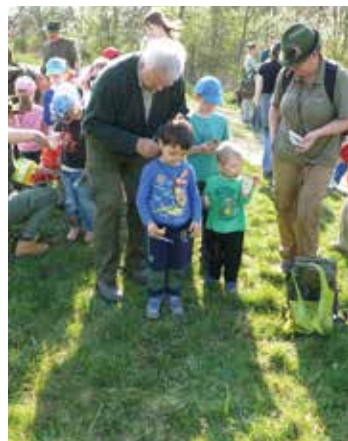
Pamětní medaile na rozloučenou

Potom následovala prohlídka krmných zařízení, tj. bažantího zásypu a srnčích jeslí. Na závěr dostaly děti otázky z toho, co odpoledne viděly, a za správné odpovědi byly odměněny sladkostmi. Na památku dostaly všechny děti medaile s obrázkem jelena svatého Huberta.