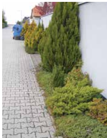
Vkusná uliční výsadba 23. IV. 2017

To však není důvodem pro tento článek. Jde o to, co se s těmito pruhy dále děje. Protože není známo, že by se o pruhy někdo zajímal, nastupuje individuální iniciativa a lidová tvořivost. Někteří vlastníci přilehlých pozemků se o pruhy vůbec nestarají a ponechávají všechno na městu. Jsou-li pruhy širší, nechá na nich město jednou za čas posekat trávu, nebo je i ošetří herbicidem, aby tam nerostlo vůbec nic. Většina vlastníků nemovitostí ale má zájem o to, jak vypadá těsné okolí pozemku a domu, takže se o pruhy stará. A to velmi různorodým způsobem. Zde je třeba říci, že to vlastníci nejenže dělají na vlastní náklady, ale že to většinou dopadá i velmi dobře. Pruhy tak částečně nahrazují chybějící městskou zeleň. Někde jsou to záhony trav a trvalek, jinde skupinové nebo souvislé keře, menší stromky, popínavé liány nebo kompaktní porosty plazivek. Jsou ovšem i extrémní, kdy si vlastník vysadí bujně rostoucí keře, o které ale nemá čas dále se starat, a ty si rostou dle svého a zaberou třeba i třetinu ulice. Opačným extrémem je odstranění veškeré zeminy a navezení kačírku nebo šterku, ve kterém neroste nic. Tomu napomáhají i již zmíněné herbicidy. Tento poslední případ je pochopitelně přípustný stejně, jako předešlé, má jen docela značnou vadu v tom, že kačírek je velmi