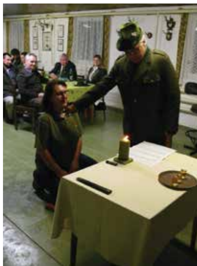
Rituál pasování na Lovce černé zvěře

Pasování patří mezi myslivecké tradice, které je třeba udržovat, a je potěšitelné, že o myslivost projevují zájem i ženy, a to jako aktivní myslivkyně či jako chovatelky loveckých psů či dravců.