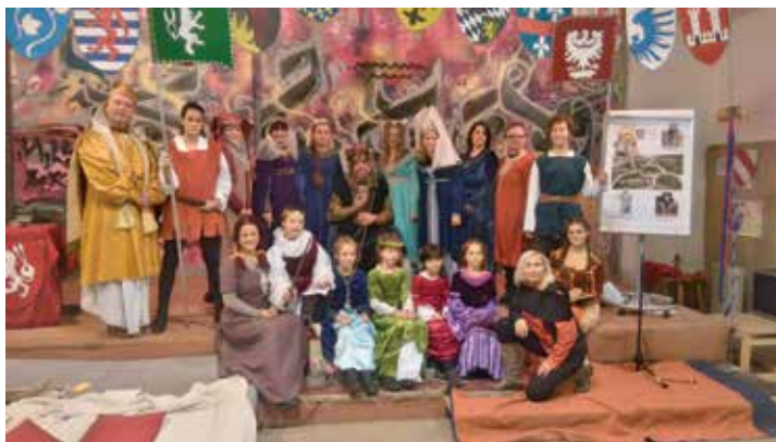
Vaše Lakomé Barky

Děkujeme i když jen zprávu o této akci pošlete dál.