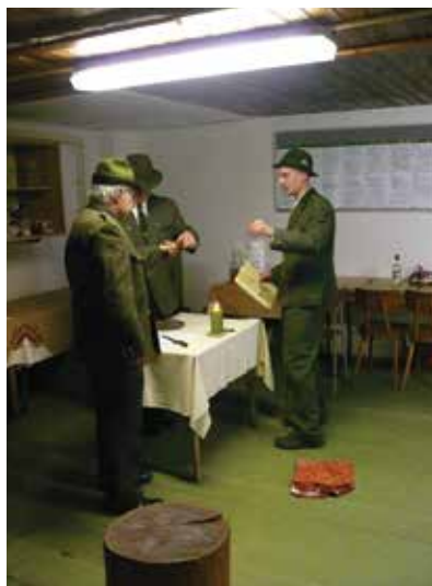
Pasování na Lovce černé zvěře s přípitkem Lovu zdar