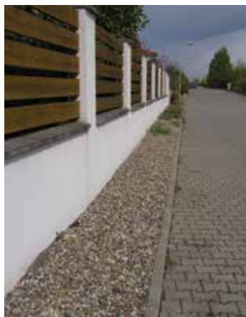
Uliční pruh jen s kačírkem, bez vegetace foto: J. Bratka, 23. IV. 2017

Občané denně chodí či jezdí kolem zajímavého fenoménu, který v Klecanech existuje skromně a nenápadně, přitom ale docela výrazně formuje prostředí obce. Na mnohých místech, zejména v nové výstavbě, jsou součástí ulice (nebo snad chodníků?) nezpevněné pruhy půdy, které jsou různě široké, od cca 15 cm třeba až do dvou či více metrů. Jsou mezi oplocením a vlastním chodníkem nebo vozovkou a jejich původním účelem mělo asi být umístování podzemních sítí, plynu, vody, telefonu nebo místního rozhlasu. Skutečnost je však taková, že jen málokdy tuto funkci splňují, většinou však jsou jen jakýmsi nárazníkem mezi intenzivně užívanou ulicí a soukromými pozemky. První otázkou tedy je, komu tyto pruhy skutečně patří? Jednoduchá odpověď je – no přece městu! Ve většině případů tomu tak opravdu je, ale na mnoha místech jsou pochyby o skutečném stavu. Nikdo totiž nikdy nekontroloval přesnost za-