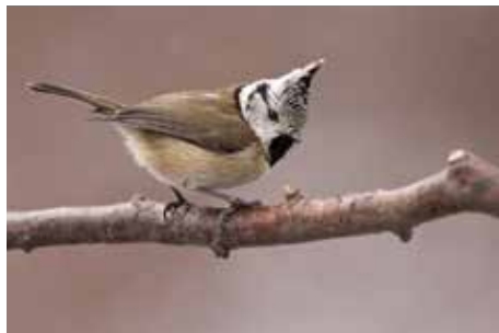
Sýkora parukářka, 30. IV. 2014

vě. Hlavu má jinak bílou, černě orámovanou, hřbet žlutavě šedý a spodní část těla bělavou. Parukářka hnízdí spíše ve vyšších polohách, kde ke hnízdění snadněji nalézá jehličnaté stromy nebo keře. Žije i v nižších polohách, ale podmínkou je vedle dostatku potravy nějaká pěkná a hustá jehličnatá dřevina. Což může být i plot ze stříhaných zeravů, i když tyto ploty jsou z obecně estetického pohledu poněkud již fádní. Hnízdo si parukářky staví v dutinách, nebo i v umělých budkách, ale není-li nic takového po ruce (respektive po běháku), postaví si je i v temné spleti větvíček v husté thuji, jalovci nebo cypřišku. Využívají někdy také stará hnízda veverek, střízlíků a dravců. Do hnízda snáší samička pět až sedm bílých, na tupějším konci načervenalých vajíček, na kterých sedí pouze samice. Samec ji při sezení krmí. Hnízdění se odehrává mezi dubnem až červenem, a probíhá zpravidla jedenkrát za rok, výjimečně i dvakrát. Inkubace trvá 15 až 18 dnů. Po vylíhnutí staří krmí tři týdny a poté ještě i po opuštění hnízda asi dva týdny. Pak už se mladé parukářky musí postarat o sebe samy. Celý proces výchovy mladých tedy zabere až 50 dnů.