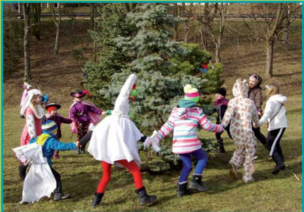
Klecanský masopust 2017