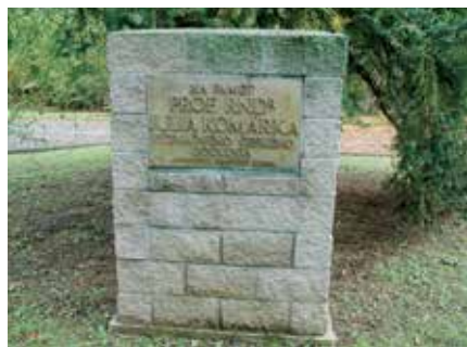
Památník zbudovaný MS Obrok