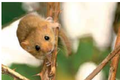
Plíšík lískový, foto Patrik Zima, 28. srpna 2016

přátel, jako jsou sovy, lasice hranostaj, kuna lesní i skalní, ale také toulavé domácí kočky. Do podzimu tak přežijí z deseti nejvýše tři jedinci. Tito šťastlivci se od mámy osamostatňují už po čtyřiceti dnech.