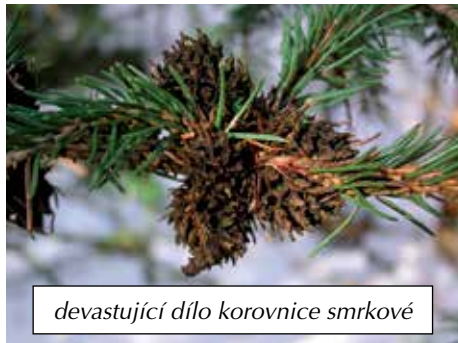
devastující dílo korovnice smrkové

U pokojevých květin zvýšíme závlivku a začneme přihnojovat.