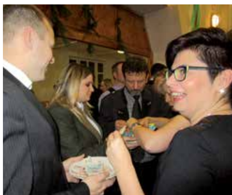
Prodej lístků do tomboly