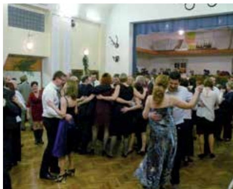
Ve víru tance