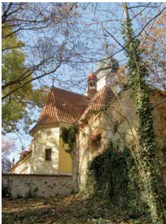
kostel v Klecanech 2. XI. 2015

a dlouhodobé zlepšení obytnosti města. To by mělo vycházet z objektivního posouzení stavu, ve kterém se Klecany nacházejí. Jistě je nepopiratelný vliv Prahy, v důsledku čehož Klecany nemají a nebudou mít postavení srovnatelného městečka třeba na Broumovsku nebo na Vysočině. Tam jsou taková městečka často přirozenými ekonomickými, kulturními a politickými centry. Toho prostě Klecany nedocílí. My například ani nevíme, jestli máme nějaké společenské a obchodní centrum. Zrekonstruované náměstí jím dle mínění mnoha občanů není, takže se zdá, že tam není ani centrum. A to u nás není jediný problém. Proto by mezi strategické cíle mělo patřit zevrubné urbanistické a architektonické vyhodnocení města a postupné, ale výrazné zlepšování v těchto oblastech. Město je konglomerátem všelikých stavebních stylů různé kvality, proto bychom měli