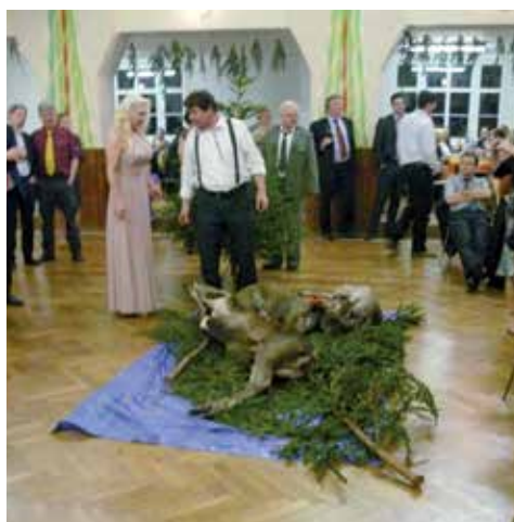
Šok z výhry selete