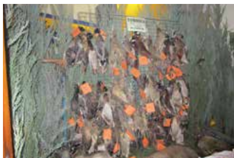
Výstavka pernaté zvěře