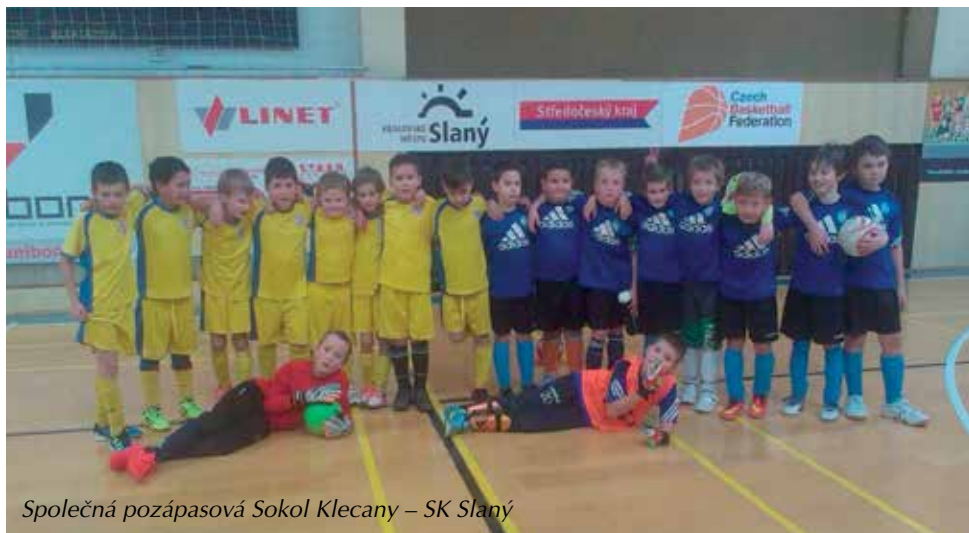
Společná pozápasová Sokol Klecany – SK Slaný