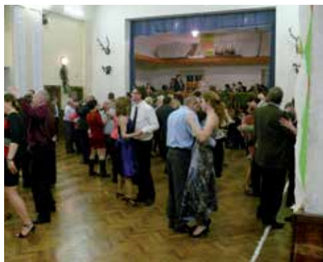
Sál plný tanečníků