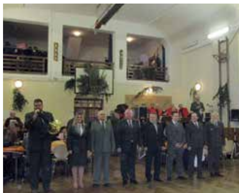
Nástup s trubačem