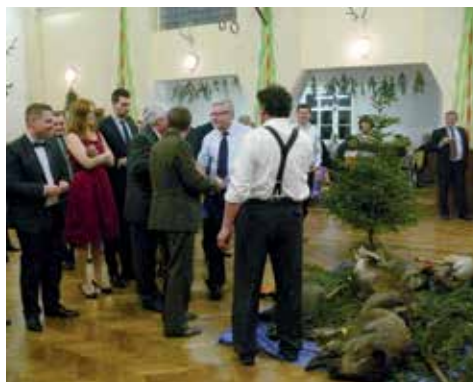
1. cena kolouch jelena evropského