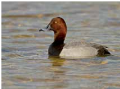
Polák velký (kačer), autor snímku Patrik Zima, 31. května 2014

Od té doby počty spíše klesají, někdy i zantně, např. po nákaze botulinózou. V našem okolí uvidíte poláka velkého vzácně jen v Klecánkách na zimní Vltavě, ale jen v zimě opravdu tuhé, jako je letošní. Pouze tehdy byl zde i dříve několikrát pozorován, a jednalo se o ptáky ze severní Evropy. V mírných zimách se tyto hezké kachničky soustřeďují raději na rybnících, i hodně blízko lidí, kde snadněji získávají potravu. Naši poláci však na zimu většinou odlétají do Středomoří. Tah poláků na zimování probíhá od září do října, zpět na sever se vracejí v dubnu.