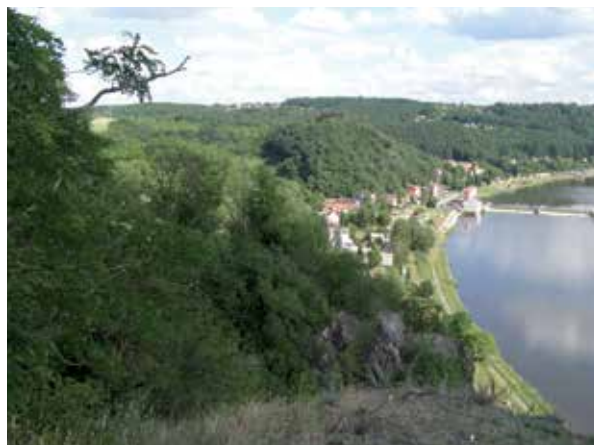
Klecánky při pohledu od Klecanského háje 14. VI. 2016

Podívejme se tedy do dotazníku. Má čtyři hlavní části, v nichž je celkem 27 otázek. Ty pokrývají velkou část potřeb a zájmů města a občanů, kterými jsou doprava,