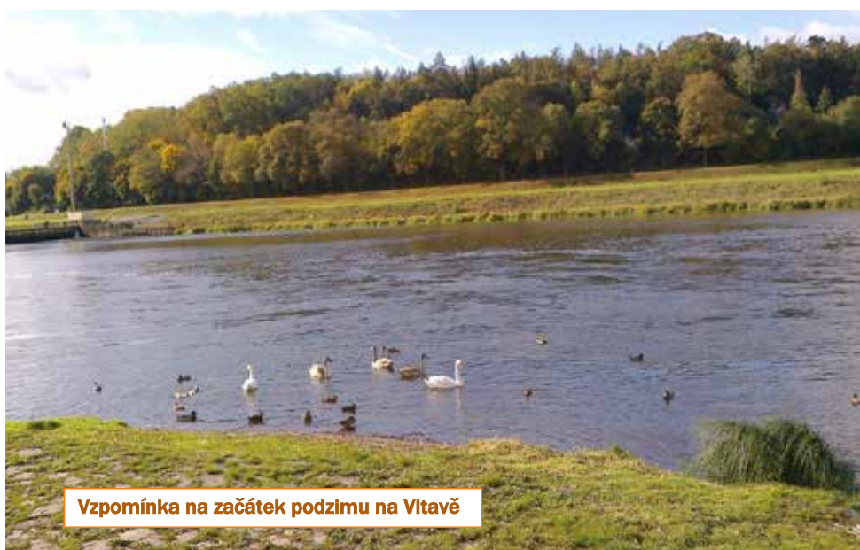
Vzpomínka na začátek podzimu na Vltavě