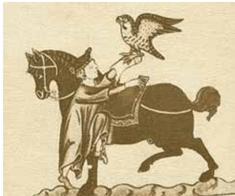
Nimrod se sokolem

Sokolnictví je způsob lovu zvěře a ptáků pomocí cvičených dravců, zejména sokolů, jestřábů a orlů. Je to specifická oblast lovectví, která má své zvláštní metody a zcela se odlišuje od běžné myslivosti, což platilo dříve a platí to i v současnosti.