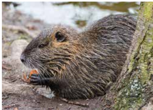
Nutrie říční, autor snímku Margita Nagelová, 12. dubna 2015

Po naší vlasti se stále šíří noví a noví obyvatelé z řad rostlin a zvířat. Někteří jsou možná žádání, ale většina z nich vítána není, a mnozí nám významně škodí. Jeden živočich z řádu hlodavců nastoupil tažení po českých zemích asi před dvaceti lety, nejspíše proto, že uni-