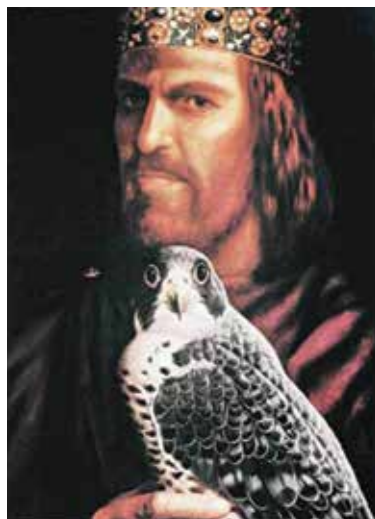
Fridrich II. se sokolem

Na území českého přemyslovského státu se setkáváme s počátky sokolnictví poměrně pozdě, až ve třináctém století. V té době vznikaly osady zřizované jako sokolnické dvory v blízkosti královských hradů uprostřed známých loveckých revírů. Jako příklad může sloužit osada Sokolí dvůr (později Falkenau, Falknov, Sokolov) v blízkosti hradu Lokte nad Ohří či Sokolec (Sokolčí) u Poděbrad, kde se tradice sokolnictví udržela až do poloviny sedmáctého století. Sokolnictví se provozovalo i na jiných místech v Čechách například na panství krumlovských Rožmberků i na panství Chlumec nad Cidlinou.