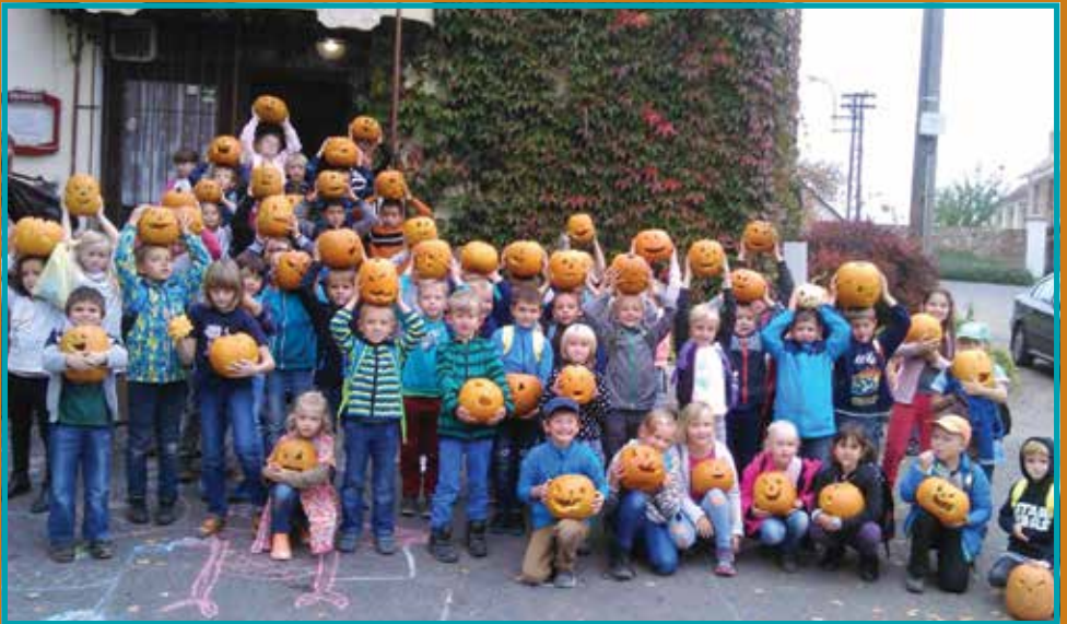
Děti ze školní družiny na Máslovickém dýňování