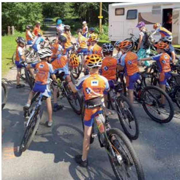
Smečka sokolíků před odjezdem do Bikeparku

cem prvního kola šla na první místo. V nejtěžším výjezdu mokrou sjezdovkou se odpoutala od své poslední soupeřky a bezchybnou jízdou navyšovala svůj náskok, který byl zhruba 500 m před cílem asi 1 minutu. A přesně v tento moment nám ukázal tento nádherný sport tu nemilosrdnou a krutou odvrácenou stranu mince. Ve sjezdu na stadion namotaný šaltr a vytrhnuté zadní kolo ze stavby. Madla posbírá doslova zbytky kola a během do cíle brání vítězství. Soupeřka se ukrutně rychle blíží. Poslední zatáčka a 200 m do cíle. A najednou tma. Vyčerpání a ztráta toho mistrovského „trička“.