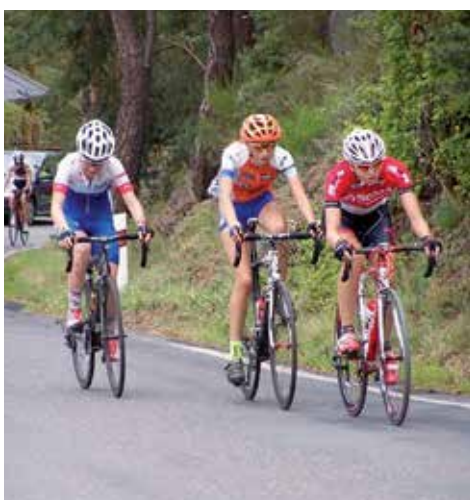
Rodičí se únik vítězné trojice na MČR silnice