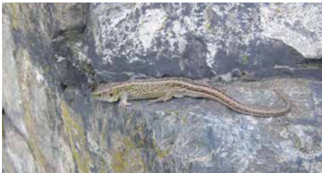
Samec ještěrky obecné, 19. IV. 2014

Téměř každý člověk se rád vyhřívá na slunci v nejteplejším období roku, od června do září. Ještě více se z tepla radují staří obyvatelé Země, plazi. Několik jejich již nepočtených zástupců hostí i Klecany. Nejčastěji je možno vidět ještěrku obecnou ( Lacerta agilis ), malého hbitého plaza,