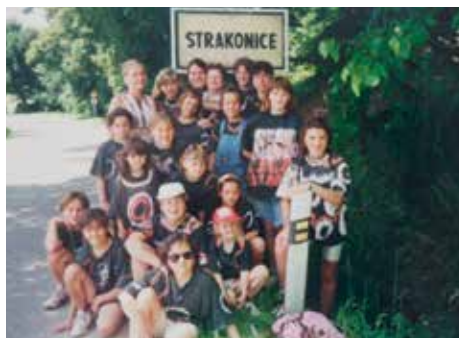
Světlušky na tábore v Sedlicích v roce 1996 a 1997