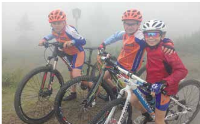
Dlouhé Stráně za mlhy

Ve starších žákyních předvedly tradiční spanilou jízdu Zuzana