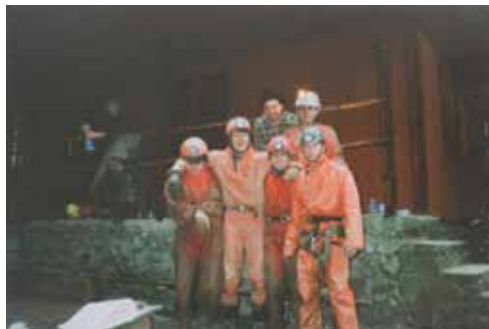
Výprava do Moravského krasu