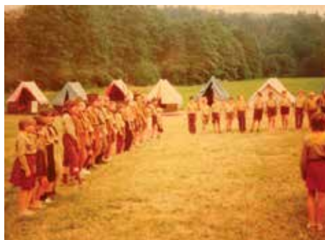
Fotky z tábora 1991 – tábor krvelačných mušek