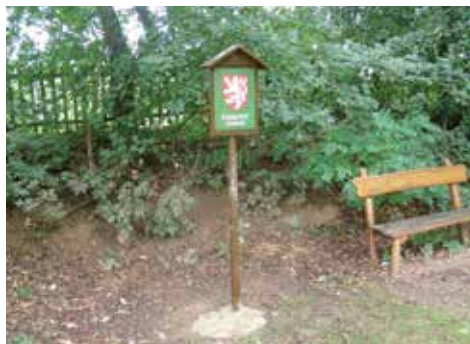
Čerstvě instalovaný stojan se státním znakem u dubu Na Hradišti