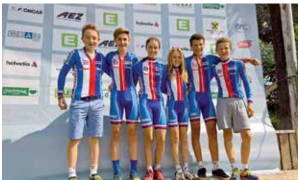
(pm) Team 1 a 2

Gratulujeme našim reprezentantkám a děkujeme všem, kdo se podílí na chodu a přípravě mladých cyklistů a cyklistek v oddíle Sokol Veltěž. V neposlední řadě také děkujeme za podporu všem sponzorům a partnerům.