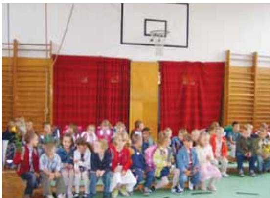
Foto: z deníku 9.A – první školní den