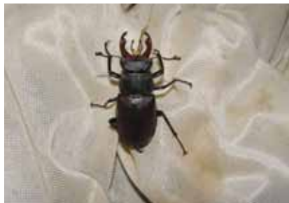
Menší forma roháče s malými kusadly, 4.VII. 2013.