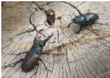
Roháč obecný v Klecanském háji, samec a samice, 2.VII. 2015.

Roháč obecný je chráněný zákonem. Ve střední Evropě má několik dalších příbuzných, malých druhů roháčů, které laik většinou ani za roháče považovat nebude.