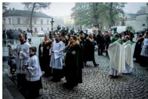
Příchod k slavnostní bohoslužbě

Známe několik hudebních provedení této mše, z nichž nejznámější je Hubertská mše B dur se zpěvy pro 3 lesnice od Petra Vacka a Josefa Selementa. Zkomponována byla v roce 1991 a byla dokonce přednesena ve Vatikánu u papeže při příležitosti darování vánočního stromu.