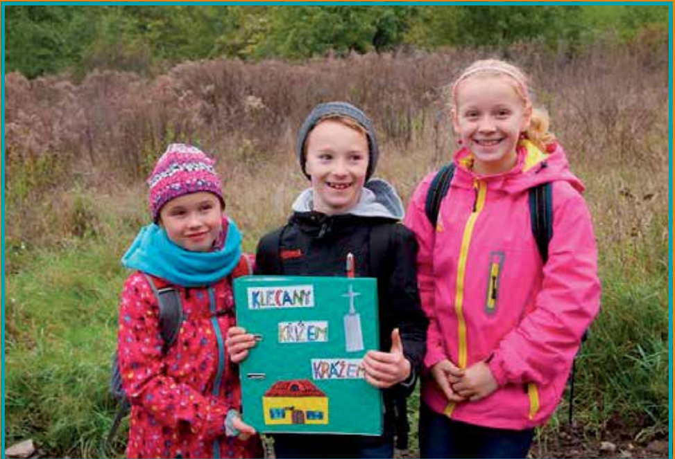
Žáci 3.A ZŠ a MŠ Klecany