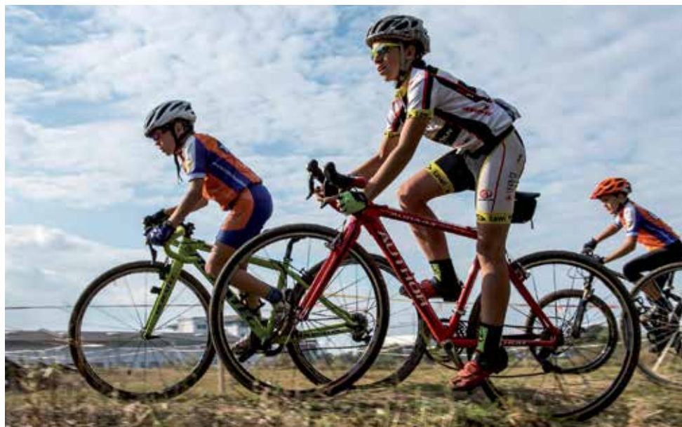
Kluci bojují na trati

Letos již máme za sebou první čtyři závody Českého poháru, oranžové dresy jsou vidět zase o kousek více než loni, což nás těší. Zejména v kategorii děvčat se jezdí zatím všechny závody v naší režii. Čtyři závody = čtyři vítězství pro Sokol Veltěž, v průběžném pořadí máme