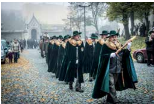
Příchod členů Řádu

Jak již bylo řečeno, velice populární je svatohubertská mše, což je mše svatá k uctění patrona lovců a myslivců svatého Huberta, při níž zpěv a lovecké dechové hudební nástroje provázejí jednotlivé mešní části a při níž kázání je věnováno svatohubertské legendě a jejímu odkazu.