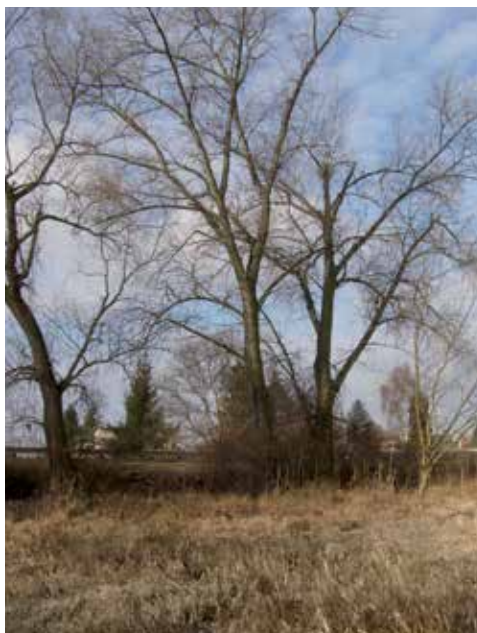
Část mokřadu u bývalé vodárny, pohled k severozápadu, 20. II. 2014, foto J. Bratka

Předmětná plocha je v územním plánu vyznačena jako „zeleň“ a dle právního stavu je to registrovaný krajinný prvek. Tedy území, kde by se mělo hospodařit tak, aby nedošlo k zásadní negativní proměně, nemizely rostliny, stromy, lovná zvěř a vůbec živočichové včetně veselých ptáčků a motýlů. Kromě toho se tam občasně hromadí dešťová voda, stékající z širšího povodí a velmi významnou skutečností je to, že jsou zde vrty na pitnou vodu. Každá z těchto věcí stojí za samostatnou i ucelenou pozornost. Za dobu posledních cca deseti let, co do mokřadu občasně s kolegy docházíme, tam bylo zjištěno několik druhů chráněných živočichů i dalších, které sice chráněny vyhláškou nejsou, přesto ale ve středočeské, tedy i v klecanské přírodě vytrvale mizí. Jsou to např. obojživelníci tří druhů, dva druhy plazů, dvanáct druhů ptáků a několik set druhů bezobratlých živočichů, zejména hmyzu (ploštic, rovnokřídlých, blanokřídlých, brouků, motýlů a dalších). Co se týká lovné zvěře, tak je ten prostor dosud migračním koridorem srnce a divokého prasete