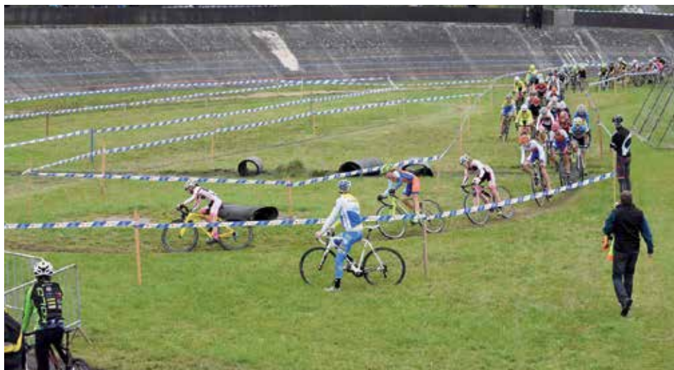
Početné pole kadetek v Lounech

5 holek mezi prvními devíti závodnicemi a bezpečně vedeme týmovou soutěž. Moc si přejeme, aby nám tato forma vydržela co nejdéle.