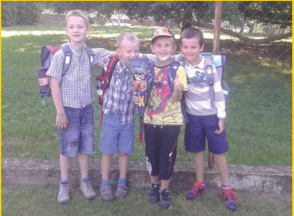
Prvňáci ze třídy 1.B – ZŠ Klecany