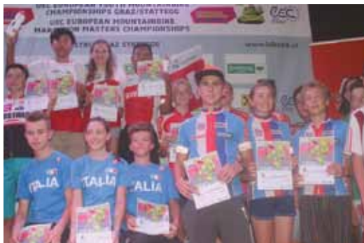
Vyhlášení týmů U15 – 5. místo

Gratulujeme oběma reprezentantkám a děkujeme všem, kdo se podílí na chodu a přípravě mladých cyklistů a cyklistek v oddíle Sokol Veltěž.