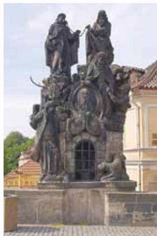
Sousoší svatých Jana z Mathy, Felixe z Valois a poustevníka Ivana

Svatý Felix z Valois pocházel ze šlechtického rodu hrabat z Vermandois, ale již od mládí projevoval soucit s chudými a nešťastnými a zděděné bohatství využíval