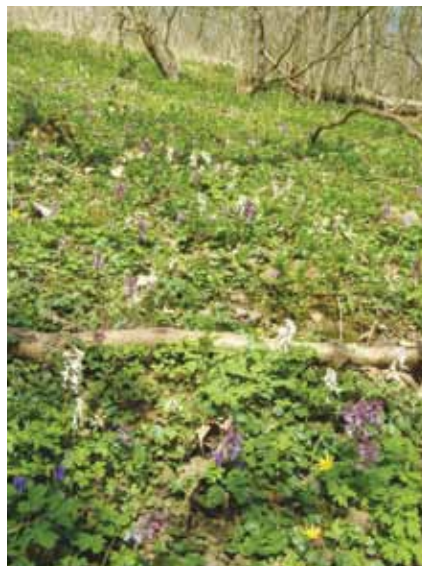
Jarní flora Klecanského háje poblíž bývalé hájovny, 9. dubna 2015

Bohužel nic z toho není pravdou. Je to klamavá reklama, zastírající skutečnost, že LČR se myšlenkově nachází někde uprostřed devatenáctého století, i když se mezitím dějiny dávno posunuly jinam a v lesích již nevidíme jen plantáže na dřevo. Jistě – růst a vývoj lesa se počítá na staletí, nelze vše provést najednou. Proto LČR pro jistotu se změnami ani nezačnou. Avšak pokud se vám poštěstí hovořit s jejich zástupci, tak vám přesvědčivě vysvětlí, jací jste nedoukové, amatéři a duševní chudáci, ale možná i sabotéři a diverzanti, přičemž oni vám přece poskytují nesmírnou laskavost, že s vámi hovoří. Vždyť jde jen o takovou drobnost, že si tam pokácí vše, co je napadne.