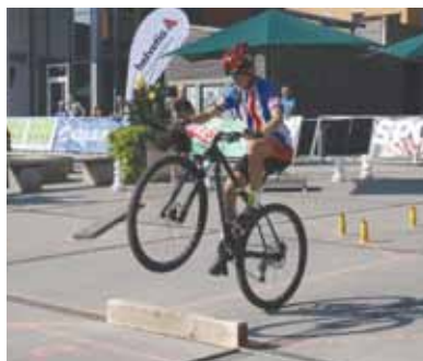
Zuzka překonává kládičku

také díky nabitému startovnímu poli, kde se sešlo téměř pět desítek nejlepších bikerek z celé Evropy.