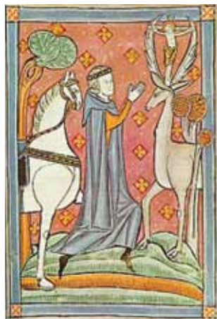
Svatý Eustach 1

Již v březnovém vydání Klecanského zpravodaje v roce 2012 jsme věnovali článek svatému Hubertovi, což byl francký šlechtic z přelomu 7. a 8. stol. n. l. Ten, pod dojmem setkání s jelenem, kterému mezi parohy zářil kříž, zanechal hříšného způsobu života, obrátil se k Bohu, stal se knězem, nakonec biskupem a patronem myslivců.