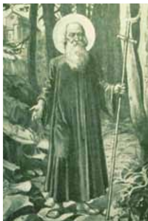
zemský patron Svatý Prokop

Dalším poustevníkem a jedním z nejoblíbenějších středověkých světců je svatý Jiljí (Aegidius), jehož atributem je laň, jejímž mlékem se živil. I mezi zemskými patrony Čech nalezneme významné svaté poustevníky, např. svatého Prokopa a svatého Ivana. Svatý Prokop je znám tím, že podle legendy zapřáhl ďábla do pluhu