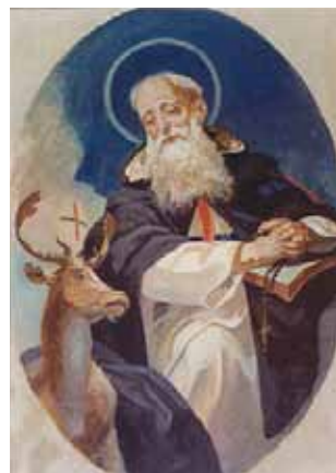
Svatý Felix s jelenem

Motiv jelena se zářícím křížem mezi parohy se však v křesťanské mytologii vyskytl mnohem dříve u svatého Eustacha a také později u svatého Felixe z Valois. Eustach (Eustachius), původním jménem Placidus, byl římským důstojníkem a vojevůdcem, který se obrátil na křesťanskou víru po tom, co na lovu spatřil jelena s křížem mezi parohy. Při pronásledování křesťanů za císaře Hadriána byl kolem roku 118 n. l. nejprve předhozen divoké zvěři, a když se ho šelmy ani nedotkly, byl upálen. S jeho jménem je spojeno založení první profesní organizace myslivců u nás, a to „Bratrstva hlubockých myslivců sv. Eustacha“ na panství knížete Ferdinanda Schwarzenberga v roce 1692.