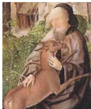
Svatý Jiljí s laní

S podporou papeže byl roku 1209 založen žebravý mnišský řád „Menších bratří“ (minorité), ze kterého se později vyčlenily řády františkánů a kapucínů. Vznikla též ženská odnož řehole – klarisky. František nemiloval jenom lidi, ale všechny boží tvory. Traduje se, že když nenalezl posluchače mezi lidmi, kázal lesní zvířetím či ptáčkům. Nebáli se ho a pozorně mu naslouchali. Je známo,