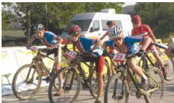
Tým Zuzky na startu týmové časovky