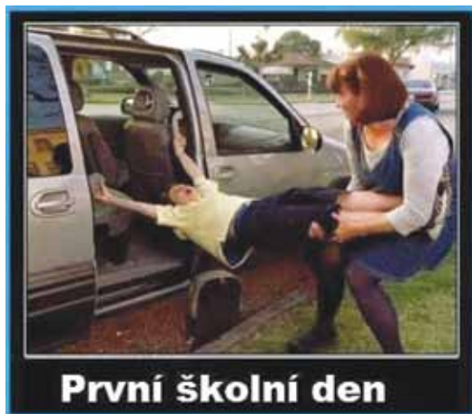
První školní den

V úterý 1. září začal nový školní rok 2015/2016 a my přejeme dětem a jejich rodičům mnoho radosti a úspěchů během celého školního roku, pedagogům hodně trpělivosti při jejich nelehké práci a prvňáčkům dobrý vstup do jejich nové životní etapy.