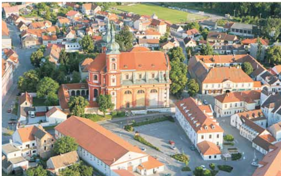
„Stará Boleslav letecky“ od Zdeněk Fiedler – Vlastní dílo. Licencováno pod CC BY-SA 3.0 via Wikimedia Commons

Roku 1609 nabývá značného významu Palladium země české. Jedná se o kovový reliéf Madony s dítětem, kterému je připisována ochranná moc nad Českými zeměmi, který byl uchováván ve staroboleslavském poutním chrámu Nanebevzetí Panny Marie. V době třicetileté války bylo město téměř zničeno. Tato zkáza přetrvávala až