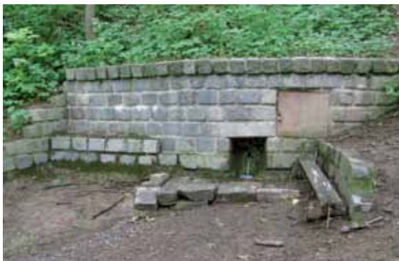
Pramen poblíž bývalé hájovny v Klecanském háji, autor J. Bratka, 21. VI. 2015

Protože voda je hlavní sloučeninou života, musíme už dnes, dávno předtím, než nastane v Evropě skutečná ŽÍZEŇ, vyhledávat staré a zaniklé studánky, studny a prameny, zjišťovat kvalitu jejich vody a uvádět je do provozu. V případě malých vodáren je třeba zachovat je plně funkční,