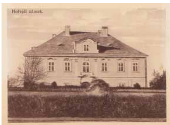
◀ Kaple sv. Anny