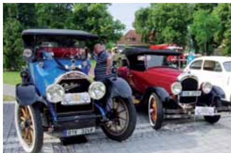
Cadillac 55 a Chrysler 1925