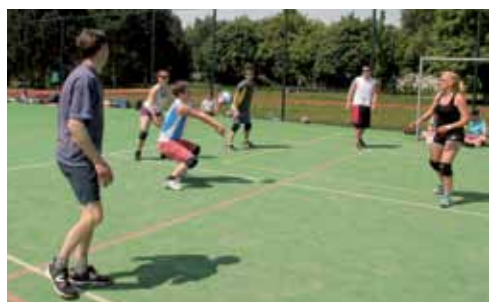
Příjem podání klecanských Vopiček

Vzhledem k množství zúčastněných družstev se kromě čtyř venkovních kurtů musely některé zápasy hrát také v přehřáté tělocvičně. Zúčastněné týmy byly rozděleny do tří skupin po čtyřech družstvech a jedné s pěti týmy. Ve skupinách se hrálo na dva sety a následný pavouk o výsledné umístění na dva vítězné sety. V případě rovnosti bodů ve skupině rozhodovalo vzájemné utkání a následně počet dosažených míčů.