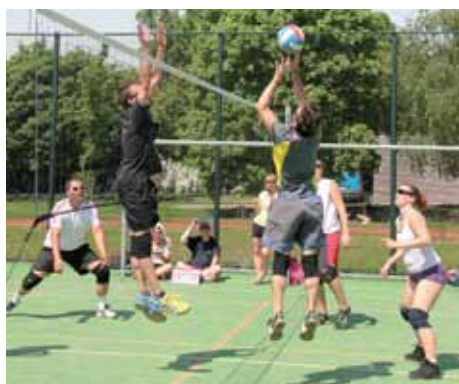
Viki z týmu Vopičky Klecany přehrává soupeřův blok

Ve čtvrtfinále Klecany prohrály s Broskvemi 2:1 na sety, a skončily na pátém až osmém místě, stejně jako vítězové skupiny A Jardíci, kteří prohráli s týmem PePa. Vopičky Klecany skončily na devátém až sedmáctém místě.