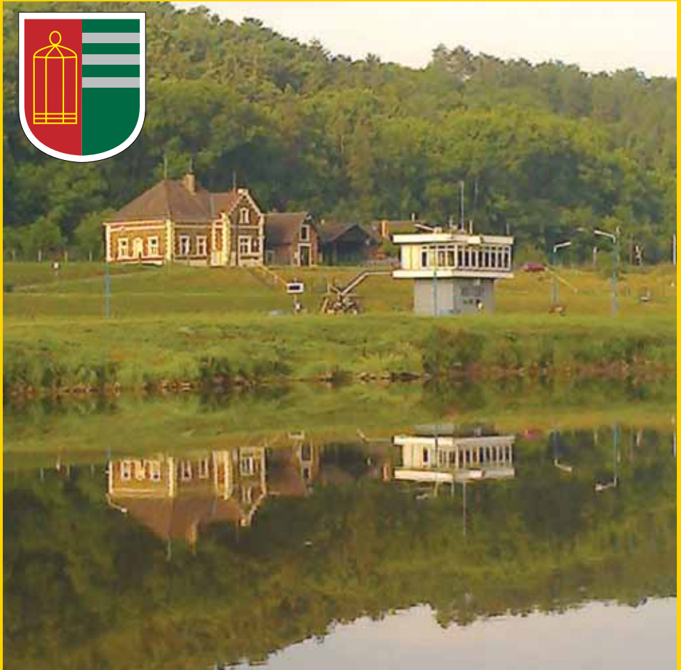
Plavební komory "zrcadlení"