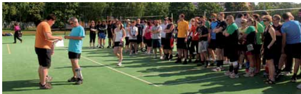
Ranní nástup sedmnácti družstev na umělém povrchu hřiště v Bohnicích