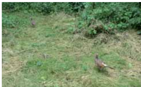
vypouštění do přírody ve vybrané lokalitě