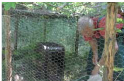
aklimatizační voliera po transportu