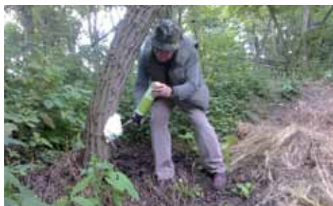
Klecany – PO přes strž – lokalita Na vinici