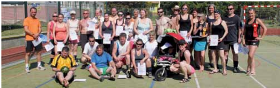
Většina účastníků druhého ročníku letního volejbalového turnaje v Klecanech

z týmu Vopičky Klecany objednali dokonalé tropické počasí, takže na dvou hřištích se mohli volejbalisté a volejbalistky dostatečně připéct.