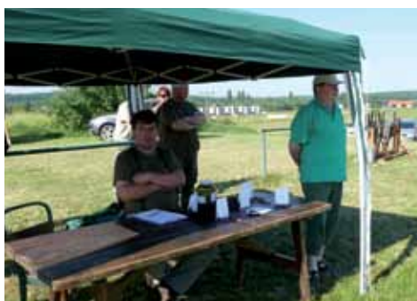
Vedoucí střelby a rozhodčí

Tak, jako pořádá náš Myslivecký spolek každý rok cvičné střelby, konají se i akce k zazvěřování honitby. Z Líhářského střediska Skuheř bylo zakoupeno 17 kusů dospělé bažantí zvěře, která byla umístěna do aklimatizační voliéry. Z té je pak po několika dnech vypuštěna do revíru ve zdibské části naší honitby. Protože se jedná o mladou zvěř, předpokládáme, že vypuštěné bažantí slepice v příštím roce zasednou na hnízda a vyvedou kuřata. I když se někdy zdá naše snaha o zazvěřování zbytečná, nepřinášející odpovídající výsledky, budeme se snažit touto cestou udržet zvěř v naší honitbě i nadále.