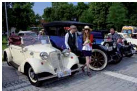
Tatra 75 Jar. Koželský Cadillac 55 1917