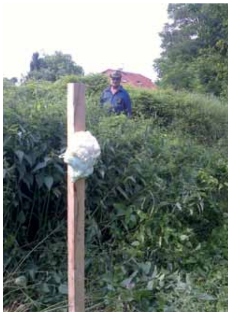
Klecany – PO přes strž – lokalita Na vinici

Na základě informace o výskytu černé zvěře v okolí okrajových obydlí ulice Na vinici jsme 11. 6. 2015 instalovali pachový ohradník. Překlenuje ochoz u vyústění strže, která láká zvěř biologickým odpadem. Na ilustračních fotografiích je zřetelná pěšinka (ochoz).