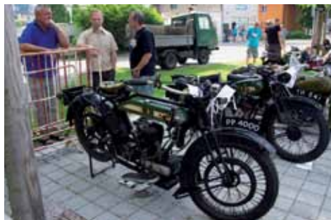
BSA 500 1927