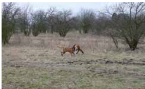
Již ji nese