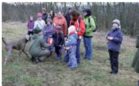
Správná odpověď, sladká odměna

V přírodě jsme strávili příjemné odpoledne i proto, že nám přálo počasí. Všichni zúčastnění se dobře bavili a bude-li zájem a příležitost, můžeme si „Procházku s myslivcem“ zopakovat. Nejen ve Větrušicích.