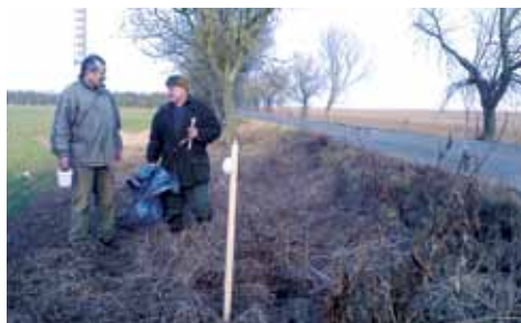
Komunikace Klecany Větrušice