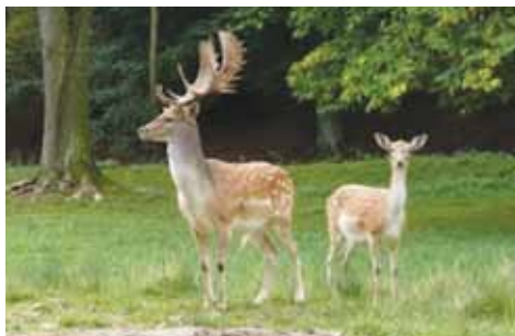
Daněk s danělou