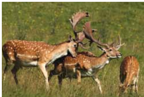
Daňci a daněla

Daňci a daněla mají krásnou srst a neobvyklým lopatovitým parožím. Pro všechny tyto vlastnosti byli daňci vyhledávanou zvěří pro královské a šlechtické obory, kde se stávali jejich ozdobou. Můžeme říci, že daněk je v naší zemi zdomácněným cizincem, protože po divokém králíku a bažantu byl třetím druhem introdukované lovné zvěře. Z obor se pochopitelně dostal i do volné přírody, kde se mu též dobře daří.