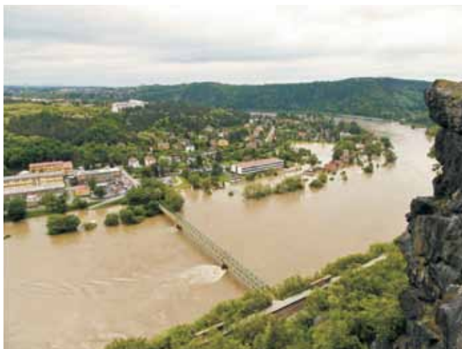
...a takto vypadala obec v době povodně

Vyšehradské kapitule. V době vlivu kláštera sv. Jiří je tato obec již uváděna u Husince pod názvem Rese (r. 1227) a od začátku 15. stol. je obec zmiňována pod názvem Rzezy. Od roku 1850 je Řež osadou obce Husinec. V letech 1850–1927 náležel Husinec do okresu Karlín. Od roku 1869 do roku 1919 byl Husinec osadou Klecan. V letech 1927–1942 byla obec součástí politického okresu Praha – venkov, následně do r. 1960 patřila do okresu Praha-sever a od roku 1960 do okresu Praha-východ.