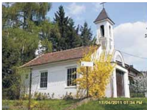
kaple sv. Václava