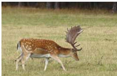
Daněk skvrnitý – lopaták