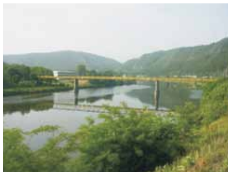
známá lávka pro pěší, která spojuje pravý a levý břeh Vltavy

Vyšehradské kapitule. V době vlivu kláštera sv. Jiří je tato obec již uváděna u Husince pod názvem Rese (r. 1227) a od začátku 15. stol. je obec zmiňována pod názvem Rzezy. Od roku 1850 je Řež osadou obce Husinec. V letech 1850–1927 náležel Husinec do okresu Karlín. Od roku 1869 do roku 1919 byl Husinec osadou Klecan. V letech 1927–1942 byla obec součástí politického okresu Praha – venkov, následně do r. 1960 patřila do okresu Praha-sever a od roku 1960 do okresu Praha-východ.