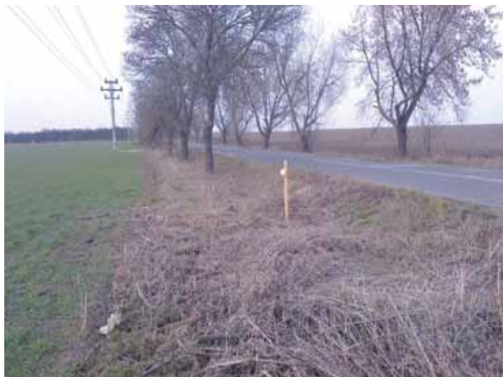
Pachový ohradník komunikace Klecany – Větrušice