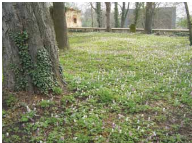
Spojení duchovní a přírodní sféry v Klecanech – kvetoucí dymnivka u kostela Nanebevzetí Panny Marie v Klecanech

Na konci každého roku se sluší trochu zapomenout na problémy a spory, které zákonitě jsou v každé obci a každém městě. Byl jsem ale několikrát osloven tak, abych upustil od přílišného zkoumání a komunální kritiky, a zaměřil se spíše na světlé oblasti našeho života. Načež jsem prolistoval řadu čísel Zpravodaje a došel k závěru, že je to tiskovina převážně optimistická a radostná, což je jistě správné, takže v mírně zneklidňujícím stylu psaní mohu klidně pokračovat i nadále.