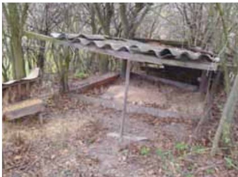
Jesličky a zásyp

Podzimní měsíce bývají pro myslivce vyvrcholením sezony, kdy se pořádají hony na drobnou zvěř. To však pouze za předpokladu, že je této zvěře dostatek. Jak je vidět