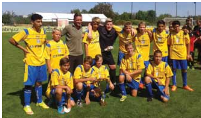
Vítězové "Šmíca cupu"