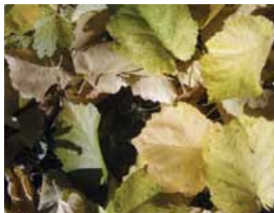
Pohled do koruny lísky turecké v údolí s vodotečí v Klecanském háji a její opadané listy, obě foto J. Bratka, 2. XI. 2015