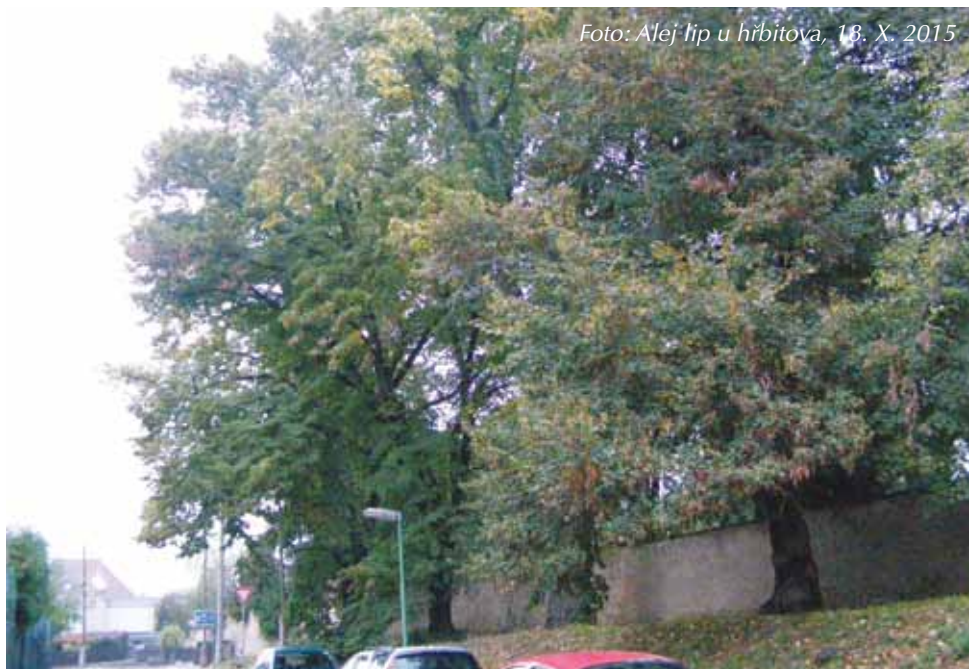
Foto: Alej lip u hřbitova, 13. X. 2015