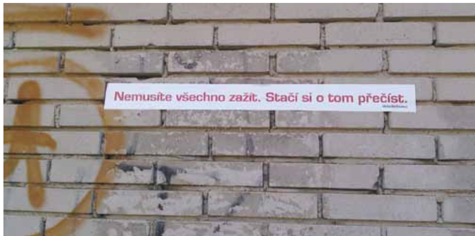
nápis na zdi klecanského hřbitova

Autorům je třeba přiznat skutečný smysl pro humor, který se sice do těchto míst moc nehodí, ale na druhou stranu je rozhodně lepší umřít vesele než celý život truchlit. A skutečně je lepší o některých věcech číst než je zažít. V tomto případě by to mohl být zážitek poslední.