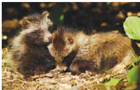
psík mývalovitý mláďata

chází v noci. Páření (kaňkování) probíhá hlavně v březnu, po 9 týdnech březosti samice vrhá 5 až 12 mláďat, která kojí skoro 2 měsíce. Psíci si na podzim vytvářejí velké zásoby podkožního tuku, podobně jako jezevci či medvědi, takže před zimou váží 8 až 10 kg. V létě pak asi polovinu. Tělo má dlouhé 65 až 80 cm, oháňku asi 20 cm, v kohoutku měří 20 cm. Zimu přečkávají v noře nepravidlým zimním spánkem, který často přerušují hlavně při oteplení. U psovitých šelem je to výjimečný jev.