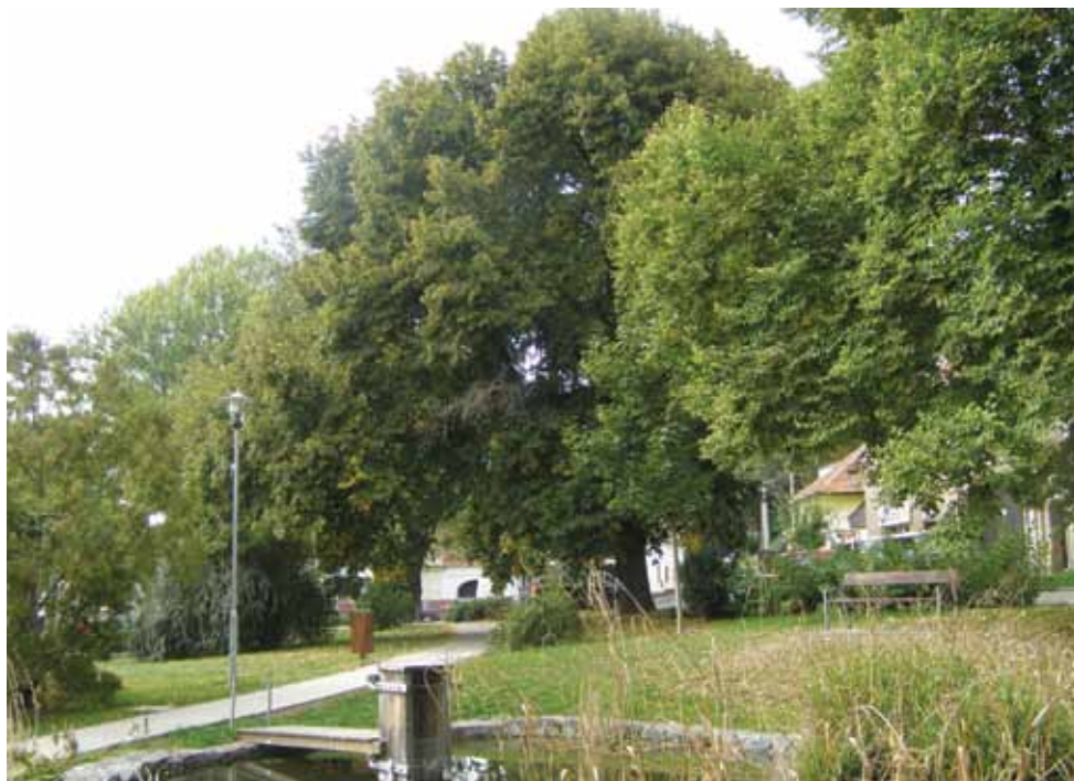
Lípy na náměstí, 2x foto J. Bratka, 22. IX. 2015

to ihned, je to dlouhodobější proces, zpravidla trvající něco mezi třemi až patnácti roky, podle toho, jestli jsou dlouhodobá sucha, a zejména dle toho, jaký druh cizopasných hub se v důsledku poškození dostane do mízní soustavy toho kterého stromu. S delším časovým odstupem je ovšem prokazování skutečných příčin velmi ztíženo, a najde se dostatek odborných dendrologů, kteří vykouzlí do svých posudků tvrzení o přirozeném zániku. Veřejnost si pochopitelně nesmí nic pamatovat, takže odborníkovi uvěřit musí.