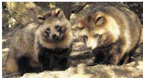
psík mývalovitý rodiče

Psík pochází z Dálného východu. Původní vlastí je Japonsko, Korea, Čína a východní Sibiř. V průběhu 20. století byl pro svou cennou kožešinu opakovaně záměrně vysazován nejprve na Kavkaze, a pak na území evropské části Ruska, odkud se nekontrolovaně šířil do západní Evropy. V roce 1959 se objevil na Slovensku, v roce 1963 na Moravě, později se zatoulal na Šumavu a jiná místa v Čechách. Přibližně ve stejné době byl již na celém území Polska. V současnosti se vyskytuje již téměř v celé Evropě.