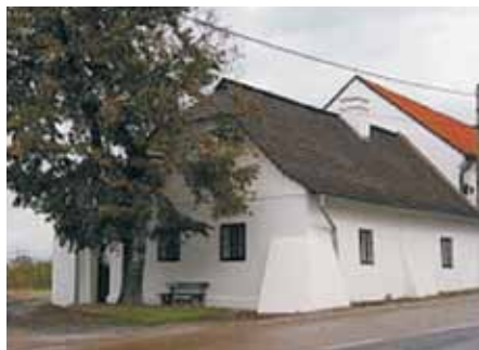
rodný domek V. Háleka