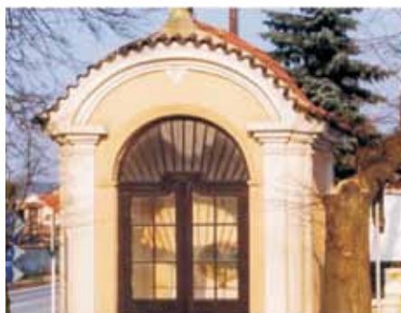
Kaplička Panny Marie v Líbeznicích