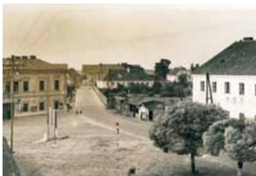
císařská silnice – historické foto