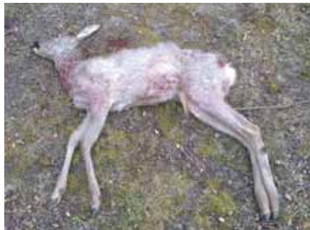
Roční srdceček stržený 5. 4. 2015 pytlačícím psem (černý kříženec vlčáka a loveckého plemene)

Červen je již tradičně označován za měsíc myslivosti a ochrany přírody. V tomto měsíci se rodí nejvíce mláďat lovné zvěře, ale i ostatních zvířat a ptáků žijících v přírodě. Přesto, že zvěř ještě neztratila svou reprodukční schopnost, její šance na přežití se s postupujícími civilizačními faktory stále snižuje. Každým rokem ubývají stovky hektarů zemědělské půdy a na nich vyrůstají průmyslové stavby, sklady, logistická centra nebo komplexy rodinných domů. A tam, kde se půda ještě zemědělsky obhospodařuje, se velmi často setkáváme jen s nekonečnými monokulturními lány řepky, bez jediné meze či remízku. Tyto lány nejsou pro zvěř úživné, poskytují však výborný kryt pro divoká prasata, a tak napomáhají k nárůstu jejich stavů. Řepka navíc způsobuje velké zdravotní problémy srnčí zvěři, spojené se značným procentem úhynu. Navíc jsou všechny zemědělské plodiny v průběhu roku několikrát chemicky ošetřovány, což vede spolu s moderní zemědělskou mechanizací k rychlému