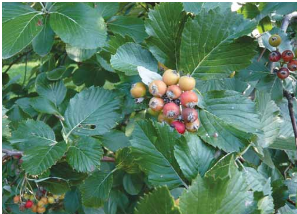
14. IX. 2014, listy a plody jeřábu dunajského na skalnatém svahu nad Vltavou u Klecanského háje