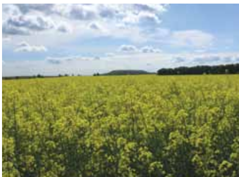
Širé lány řepky, letní úkryt černé zvěře

Naproti tomu u černé zvěře zaznamenáváme nárůst stavů z 56 986 kusů na 59 179 kusů, to je o cca 4 % více, u lišky z 56 466 kusů na 63 941 kus, to je o 13 % více.