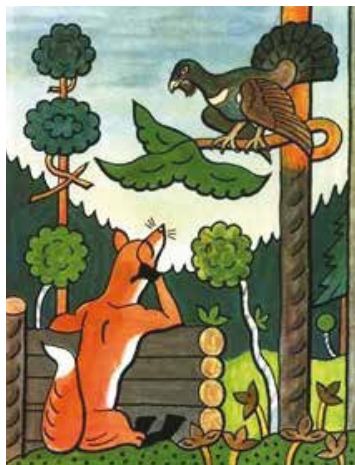
Autor: Josef Lada – Bajky