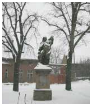
◀ Pomník sv. Václava