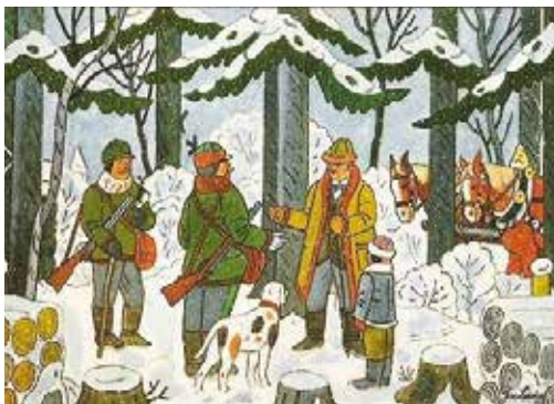
Autor: Josef Lada

Myslivecká latina je stará jako lov sám a zůstala součástí mysliveckých zvyků dodnes. Velkou měrou k ní jedinečným způsobem přispěl Josef Lada, jehož veselé, roztomilé obrázky si zamilovali mnozí myslivci, i když si z nich mnohdy s oblibou „střílí“.