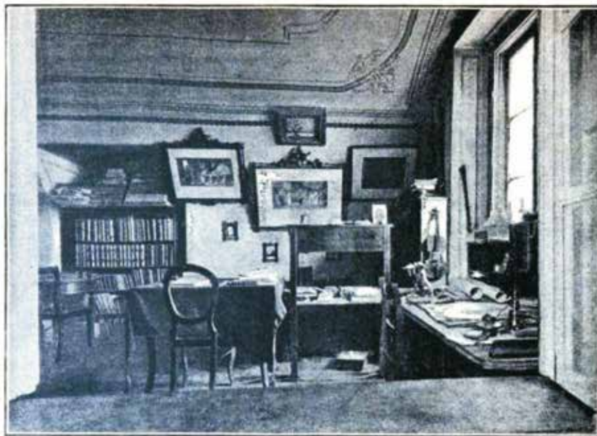
Pracovna (kaplanka) Benešova v Klecanech.

Dne 27. února 1849 se narodil Václav Beneš Třebízský – český spisovatel a katolický kněz, který většinu svého aktivního života působil v Klecanech.