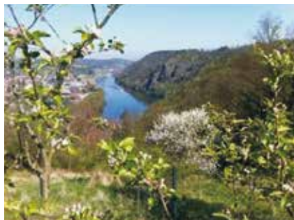
Větrušická rokle ▶