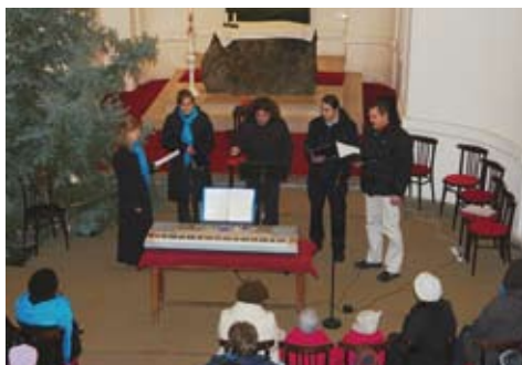
Koncert Klenoty ▲ ▼