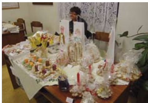
Vánoční jarmark Na Rychtě