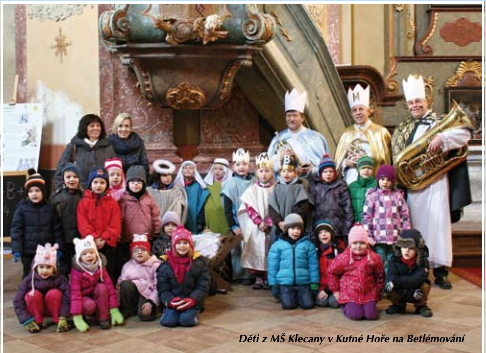
Děti z MŠ Klecany v Kutné Hoře na Betlémování