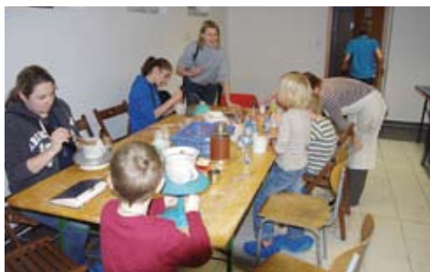
Vánoční jarmark na MÚ Klecany