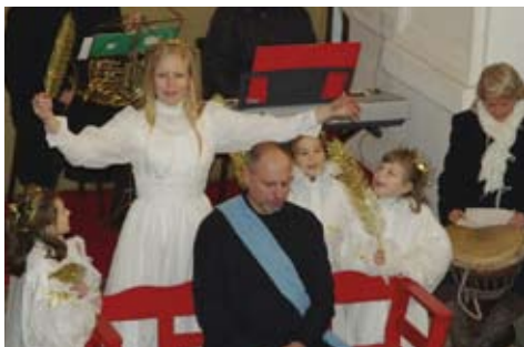
Vánoční hra ▲ ▼