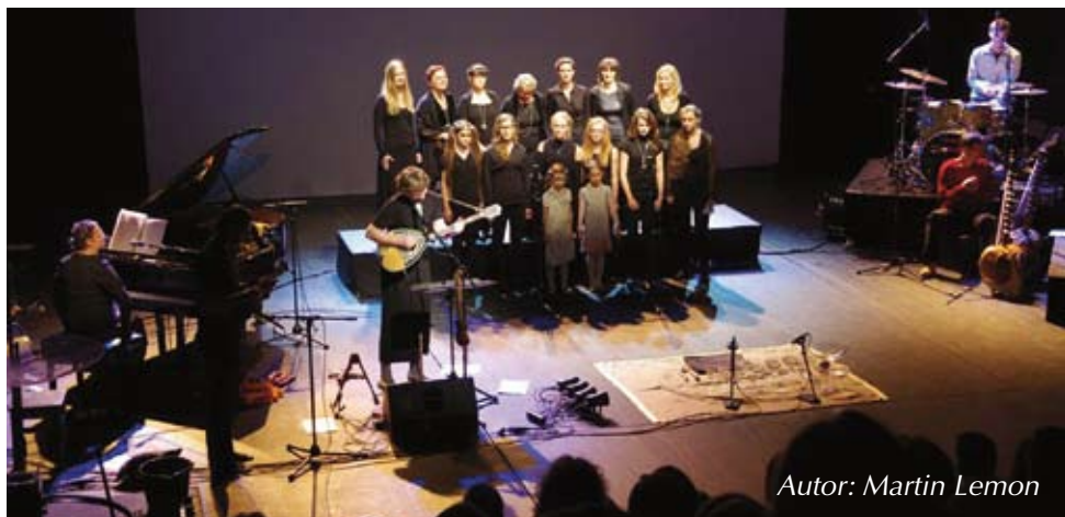
Autor: Martin Lemon