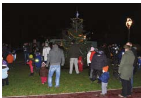
Vánoční jarmark na náměstí Václava Beneše Třebízského