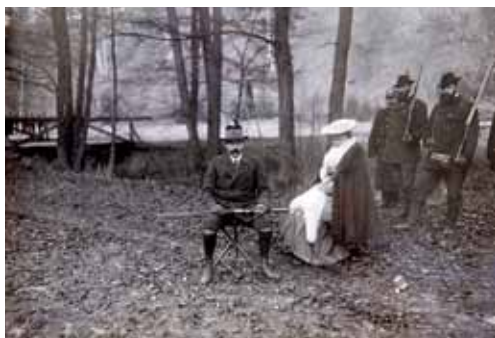
S manželkou a myslivci na Konopišti

zvířat. Tento počet kusů ulovené zvěře svědčí o tom, že s myslivostí to nemělo mnoho společného. V této souvislosti se František Ferdinand d'Este jeví jako rozporuplná osobnost jednostranně zaměřená pouze na lov a jako takovou ji bereme coby součást historie myslivosti v českých zemích. Na druhou stranu lze najít příklady, kdy na panstvích některých šlechtických rodů (Schwarzenbergové, Černínové, Thun-Hohensteinové a další) bylo se zvěří