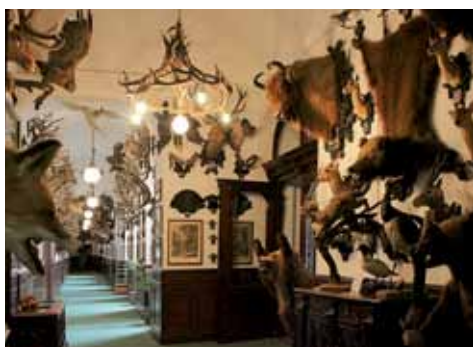
Zámek Konopiště lovecká chodba

zvířat. Tento počet kusů ulovené zvěře svědčí o tom, že s myslivostí to nemělo mnoho společného. V této souvislosti se František Ferdinand d'Este jeví jako rozporuplná osobnost jednostranně zaměřená pouze na lov a jako takovou ji bereme coby součást historie myslivosti v českých zemích. Na druhou stranu lze najít příklady, kdy na panstvích některých šlechtických rodů (Schwarzenbergové, Černínové, Thun-Hohensteinové a další) bylo se zvěří