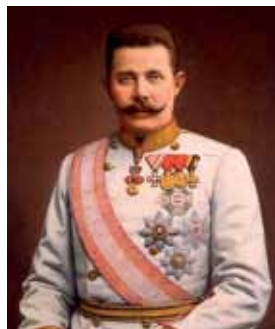
Portrét arcivévodě ve slávě s nejvyššími řády

I když byl následník císařského trůnu zavražděn z národnostních pohnutek, ironií osudu byl takto zabit muž, který měl ze všech členů vládnoucího habsbursko-lotrinského rodu nejlépe k chápání národnostních požadavků ostatních národů monarchie. Byl odpůrcem rakousko-uherského dualismu a plánoval nový státní útvar ve formě federace spojených států Velkého Rakouska, což předsta-