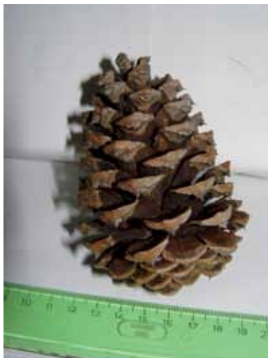
Zralá šiška, obě foto J. Bratka 18. VIII. 2014