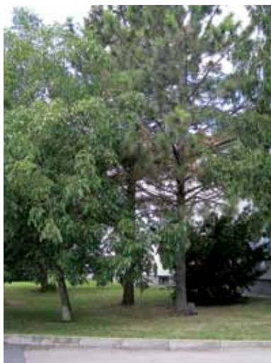
Borovice těžká u čp. 349 (první zprava), celkový pohled od jihovýchodu

Popisovaný klecanský jedinec borovice těžké je v příliš zahuštěné skupině jehličnanů, takže krajinářsky a sadovnický nevyčnívá. Přestože se mu daří relativně dobře, tak výšky 75 m zde dosáhne jen těžko. Úspěchem bude výška do 20 m.