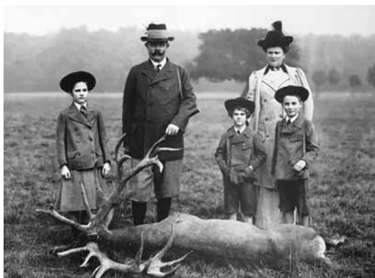
František Ferdinand s rodinou a trofejním jelenem

Mezi sbírkami jsou nepřehlédnutelné zvířecí trofeje pocházející ze zvěře, kterou arcivévoda ulovil na svých loveckých výpravách. Jsou jich tisíce, z různých kontinentů a svědčí o jeho až nezřízené lovecké vášni. I když se většina členů panovnických a šlechtických rodů zabývala lovem, v případě arcivévody Františka Ferdinanda lze hovořit o lovecké vášni přímo patologické. Podle dochovaných střeleckých záznamů skolil za svého života 272 511 kusů divokých