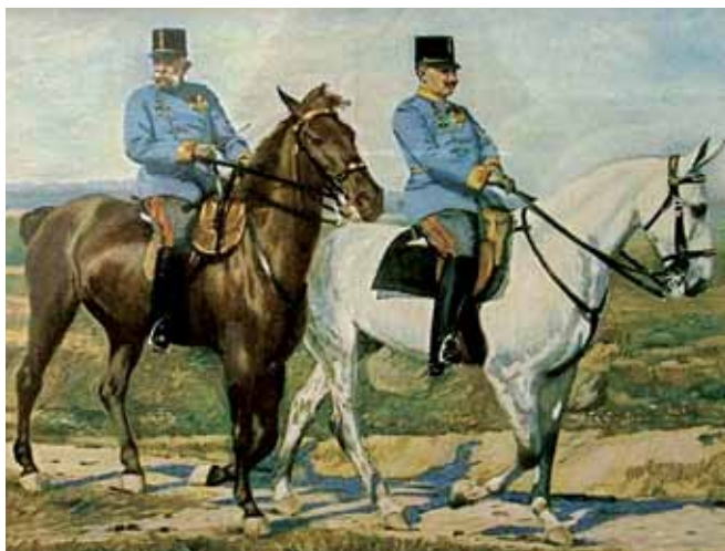
Následník tůnu a jeho strýc

vovalo 15 poloautonomních států na etnickém základě. Zda by v případě nástupu na trůn prosadil zmíněný multinárodnostní útvar, se dnes můžeme jen domýšlet. Dalším paradoxem je, že jeho smrt byla záminkou k rozpoutání války, kterou si však on sám nepřál. Jako generální inspektor veškeré branné moci si uvědomoval nepřipravenost rakousko-uherské armády i závislost Rakouska-Uherska na Německé říši císaře Viléma II. v případě války.