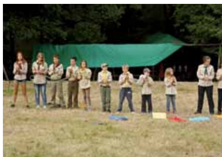
Padova – výherci etapovky