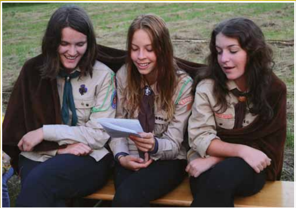
Skautský tábor 2014 – zpívání u táborového ohně