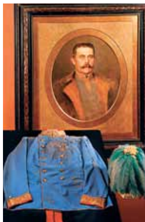
Portrét arcivévody po atentátu s kabátem uniformy