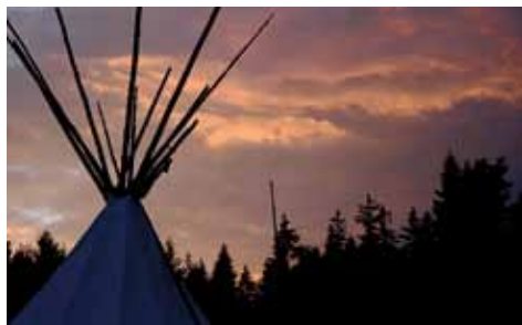
Večerní pohled na tábor