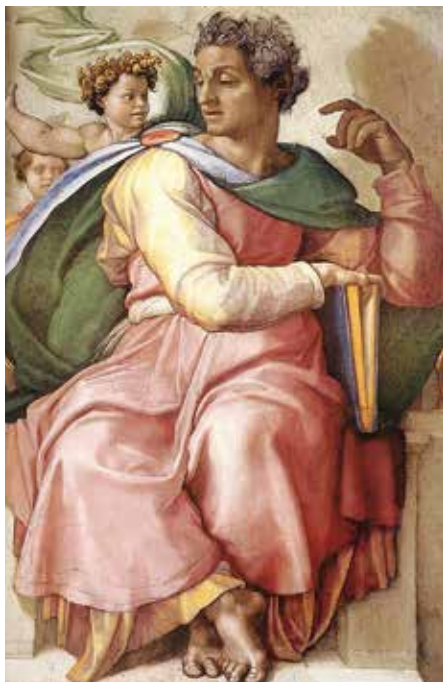
Obrázek: Michelangelovo ztvárnění Izaiáše v Sixtinské kapli.

Podobně se to zdálo lidem v historii často. Že už by měl udělat pořádek někdo shůry. Když se například starořecké drama dostalo do zapeklité situace, se kterou si ani autor ani diváci po celodenním hraní nevěděli rady, vyřešilo to zvláštní zařízení, zvané deus ex machina. Na scénu byl spuštěn stroj, z něhož vystoupil herec v masce nějakého božstva a rozřešil jakkoli zamotanou zápletku. Jak to mohl udělat? Jednoduše nařídil jedné postavě, aby odešla ze scény, jinému herci přikázal, aby se usmířil, jiného nechal zemřít a opět jiného naopak nechal nečekaně se objevit. Bylo to šikovné, ale už