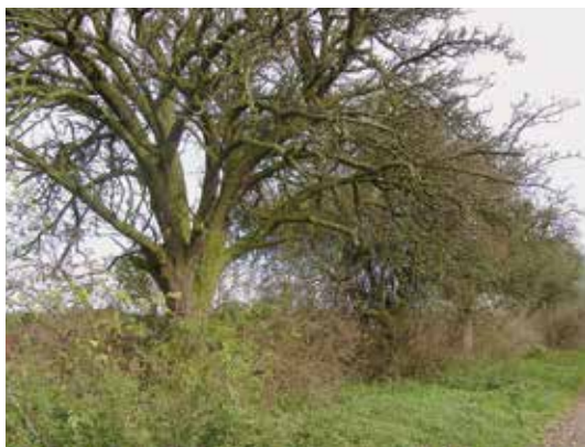
Část hrušňové aleje podél polní cesty na Drastech, pohled k jihovýchodu, 20. X. 2014

Neblahou skutečností je, že staré aleje nejen hrušní, ale i dalších ovocných stromů všude mizí a nikdo nevyvádí nové. Namísto toho jsou do krajiny zaváděny nejrozličnější ekonomicky i krajinářsky pochybné dřeviny z dovozu, obvykle za dotační,