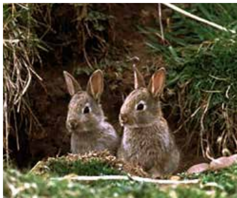
Párek králíka divokého

Kromě klimatických příčin je to způsobeno hlavně opakovanými atakami myxomatózy. Tato virová choroba, původně snad z Jižní Ameriky, byla úmyslně aplikována proti přemnoženým králíkům v Austrálii, odkud se přes Francii dostala do celé Evropy. U nás se tato dříve neznámá choroba poprvé objevila v roce 1954, bleskem zdecimovala stavy divokých králíků a následně napadla i domácí chovy. Později byla sice vyvinuta účinná vakcína, ta se však dá použít pouze u králíka domácího, u divokého můžeme spoléhat jen na získanou imunitu po prodělané nemoci. Zdali si tímto způsobem příroda pomůže a zda vzniknou kmeny králíků odolné vůči myxomatóze, můžeme jen doufat.