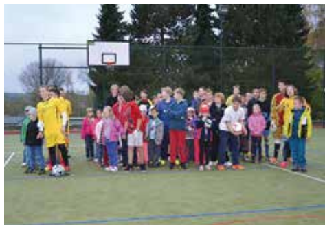
Nástup všech mužstev s doprovodem

Organizátoři nenechali nic náhodě a celý turnaj připravili do posledního detailu. Letos se poprvé hrálo o putovní poháry ředitele ZŠ a MŠ Klecany, a tak motivace vy-