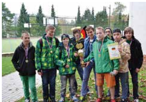
Vítězný team 9.A v barvách Německa