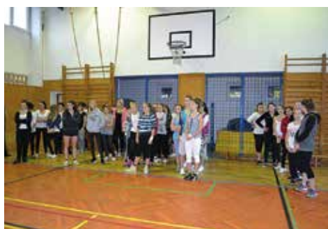
Nástup dívčích teamů v tělocvičně ZŠ