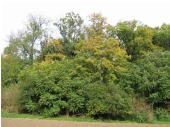
▲ Pohled na park Drasty směrem k východu 20. X. 2014