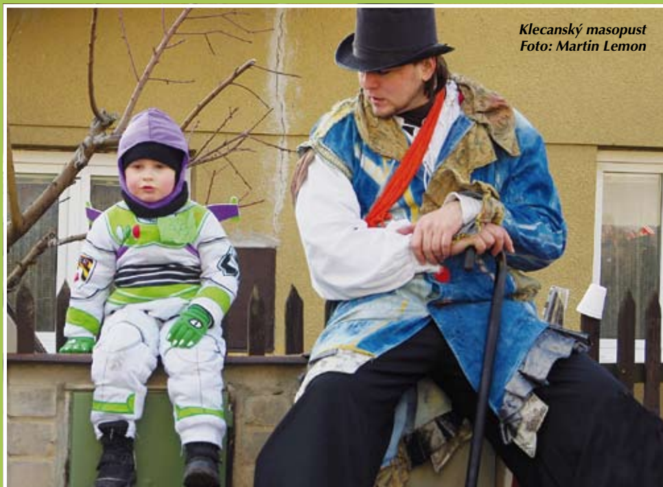
Klecanský masopust