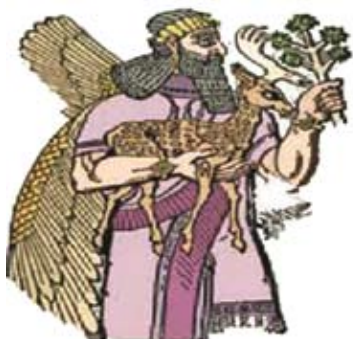
Nimrod s jelenem a ratolestí

Příroda zde byla bohatá na rákosiny, bažiny, stepi i křovinaté lesy. V nich žili jelen, daňek, divoké prase, buvol, divoký osel, zajíc, antilopa a dokonce i slon a pštros. Kromě toho mnoho stepního i vodního ptactva. Není divu, že sem byl umístěn biblický ráj.