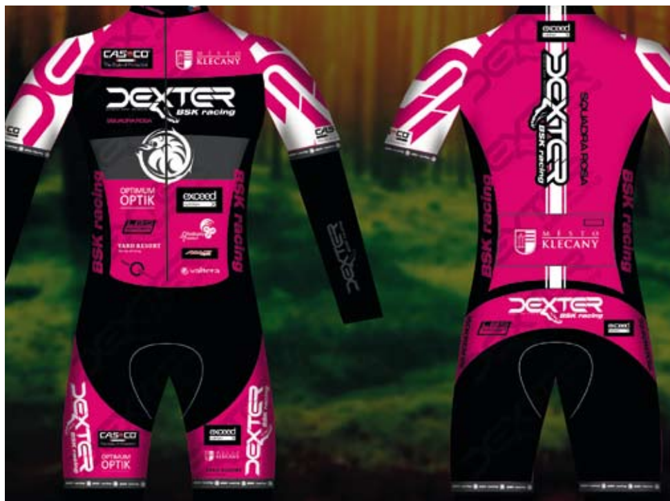
Nepřehlédnutelný design klecanských dresů pro rok 2014