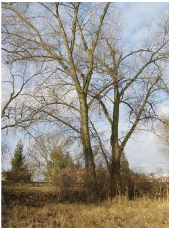
20. II. 2014, dva topoly kanadské u bývalé vodárny, pohled směrem k severozápadu

Kanadské topoly jsou dřevinou rychlerostoucí, proto byly zpočátku vysazovány především v rekultivacích u větších řek. Později se rozšířily i do silničních alejí, na polní meze a do různých mysliveckých remízků, ke hřištím, za humna obcí apod. Tam však jsou již mnohem méně vhodné, a to nejen pro zmíněné chmýří, ale i pro poměrně lámavé větve, které při silnějších větrech padají, nejraději na krásně naleštěná auta. Přes své nedostatky se tyto stromy staly typicky krajinářským prvkem a je otázkou, čím budou v budoucnu nahrazeny, protože nově se příliš nevysazují. Topol má však i dvě velmi pozitivní vlastnosti. První je to, že ve vyšším věku tvoří četné dutiny, které s oblibou osidlují ptáci i savci, a to i vzácnější druhy (holub doupeňák, sýček obecný, krutihlav obecný, plch velký aj.). Druhou a pro člověka významnou okolností je tvorba přírodního balzámu na pupenech a vrcholových větvích, který je