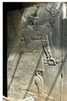
Nimrod stéla z Nimrudské brány

Nimrodovo jméno se také objevuje v názvu pahorku, jemuž Arabové dali označení Nimrud. Tady v roce 1845 vykopal britský archeolog Layard starověké město Kalchu s palácem asyrského krále Aššurnasirpala II. Tento král, stejně jako jeho předchůdci i následovníci, žil v duchu Nimrodově. V paláci byly nalezeny reliéfy s loveckými výjevy i naturalistickými obrazy zvířat, které vypovídaly o způsobu lovu asyrských knížat a staly se významnými exponáty světových muzeí.