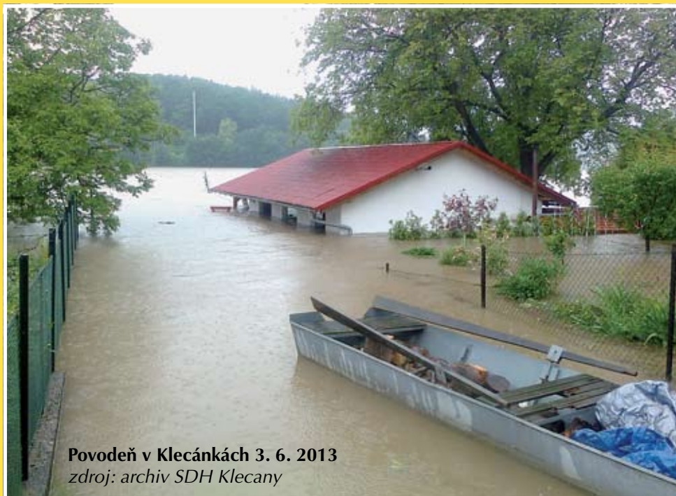
Povodeň v Klecánkách 3. 6. 2013