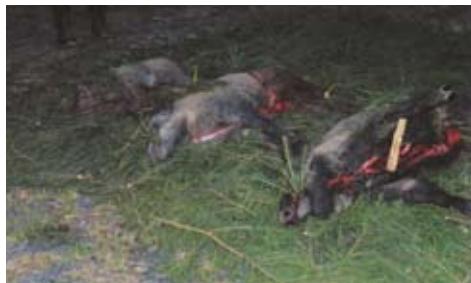
Černá zvěř – výřad po naháňce

Je zřejmé, že zredukování počtu černé zvěře je nutné a v zájmu všech, kterých se tento problém týká. Škody na zemědělských plodinách, lesních porostech i škody na drobné zvěři dosahují každoročně značných finančních hodnot. Jedinou možností, jak toho dosáhnout, je odlov, a to jak odstřelem, tak v poslední době zaváděným odchytem. O vztahu mezi početními stavy černé zvěře a jejím odlovem svědčí zajímavý údaj, že v roce 1962 bylo na území tehdejší Československé republiky odloveno 7 257 kusů a v roce 2011 pak již v České republice cca 150 000 kusů. Pro srovnání bylo v Německu ve stejném roce odloveno téměř 750 000 kusů.