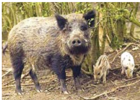
Bachyně a selata