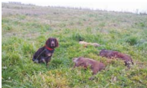
Stráž u výlože černé zvěře