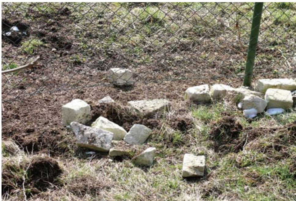
Holosmetky – tato podezdívka u plotu není žádná zábrana