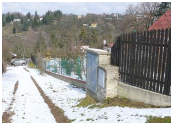
Dobré oplocení zabrání černé zvěři

naháňky. V posledních několika letech však dochází k tomu, že se černá zvěř stahuje do obydlených oblastí, jako jsou např. Brnky, Holosmetky, Draháň nebo přímo do Prahy (Bohnice, Troja). To ovšem s sebou nese podstatný fakt, že se jedná většinou o nehonební pozemky. Na těchto pozemcích se pak může provádět odstřel pouze ve zvláštním režimu, což znamená, že se tak děje na základě žádosti majitele pozemku a po schválení krajským úřadem. Toto schválení je pak vázáno na určené pozemky, osoby a časové omezení. Důležité pak je to, že z hlediska možného ohrožení života, zdraví osob a majetku je střelba kulovou zbraní v určité lokalitě vyloučena. Je jasné, že majitel pozemku, kterému prasata způsobila škodu, se s tímto faktem těžko smiřuje. Je proto na něm, aby si svůj majetek zabezpečil odpovídajícím způsobem, a to například betonovou podezdívkou plotu. O účinnosti tohoto opatření svědčí i fotografická dokumentace uvedená níže. O tom, že myslivcům není lhostejný stav divokých prasat v honitbě Zdiby – Klecany svědčí to, že v uplynulé lovecké sezóně roku 2012 bylo odloveno 49 kusů černé zvěře.