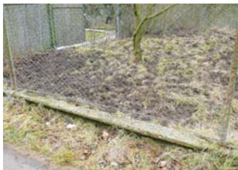
Opravený plot rákosovou tyčkovou