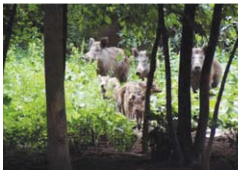
Divočák – černá zvěř – rodina

K nebyvalému růstu početních stavů černé došlo z několika navzájem se podporujících příčin. Tato zvěř se vyznačuje neobyčejnou plodností, kdy bachyně metá (rodí) 4 až 10, ale i více selat, a v době dostatku potravy a vhodných klimatických podmínek i dvakrát ročně. Ze stejných důvodů se dostávají do chrutí (říje) stále mladší samice a nárůst početních stavů se tak zrychluje. Druhým důvodem je velkoplošné zemědělské hospodaření, kdy na velkých lánech se pěstují plodiny, ve kterých nachází černá zvěř po většinu roku obživu a kryt. Jedná se hlavně o kukuřici a řepku, jak se může každý přesvědčit na vlastní oči, když se rozhlédne po našich polích. Kromě toho je divoké prase všežravec a dokáže se obživit i v podmínkách méně příznivých. Jeho potravou jsou různé rostliny, výhonky, kořínky, bukvice, žaludy, zrní, ovoce, ale i hmyz, myšovití a mršiny. Smlsne si však také na mláďatech jiných živočichů. Černá zvěř dokáže putovat za potravou i několik kilometrů při svých, hlavně nočních, přesunech. Dalším důvodem přemnožení je absence velkých šelem, jako je medvěd, rys nebo vlk v naší přírodě.