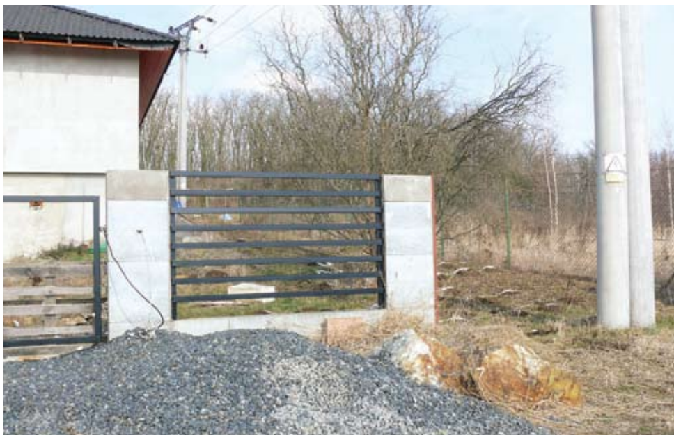
Holosmetky – bezbariérový přístup černou zvěří vítaný