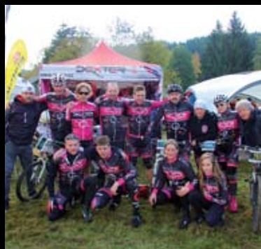
Část sestavy, která se zúčastnila loňského závodu „Nova Author Cup“ v Jizerských Horách.

Doufáme, že právě začínající sezóna nám všem přinese příjemné zážitky na kole a klecanským dětským i dospělým závodníkům mnoho úspěchů a že Klecany budou v cyklistickém světě zase vidět o něco více.