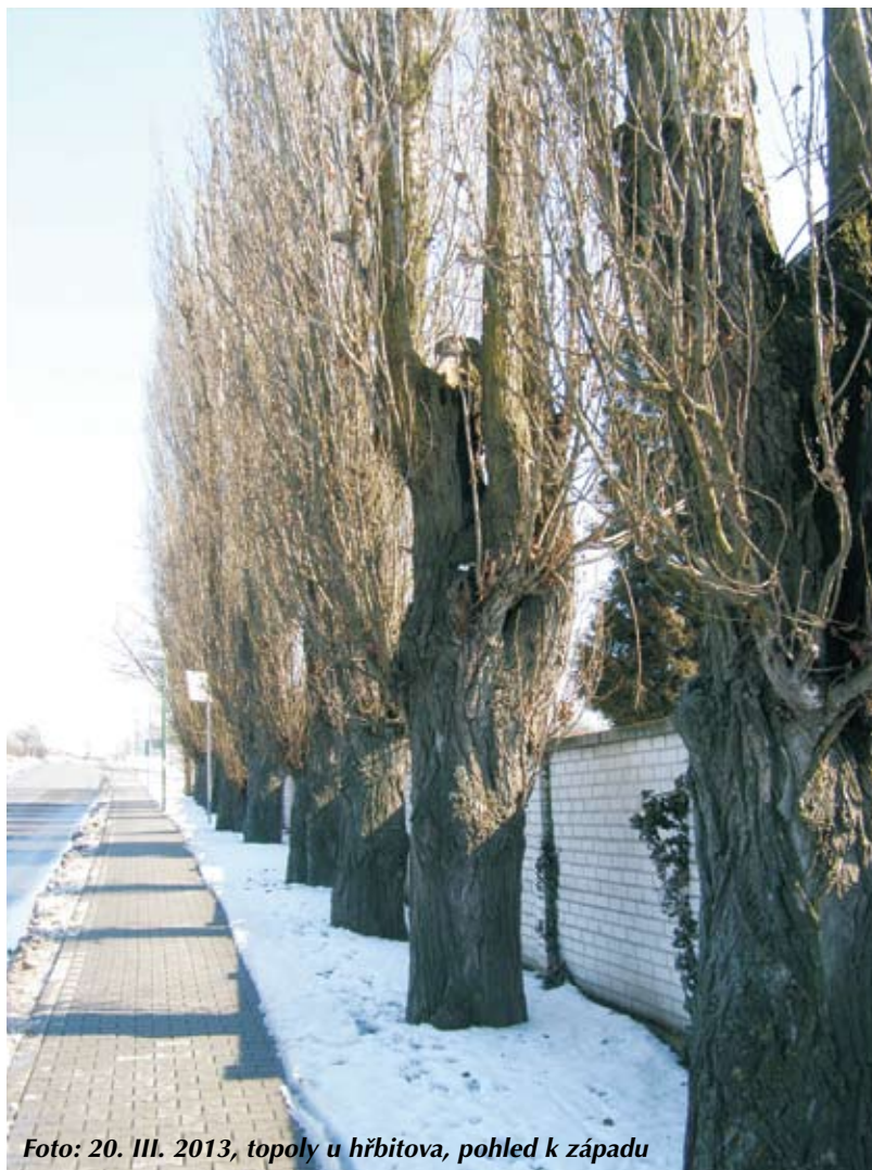
Foto: 20. III. 2013, topoly u hřbitova, pohled k západu

Topol černý ( Populus nigra f. Italica ), lidově vlašský topol nebo zahradníky nazývaný také topol pyramidální roste v krátkém stromořadí u hřbitova, takže jej zná každý obyvatel Klecan. Mezi všemi listnáči parků, zahrad a volné krajiny vyniká neobvyklým sloupovitým tvarem. V Čechách jsme si na něj však již dávno zvykli a považuje-