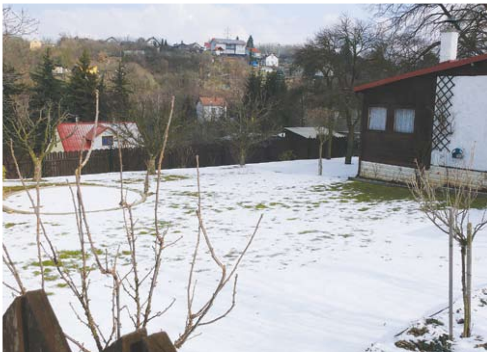
Dobré oplocení vedlejší parcely zabrání černé zvěři

Je zřejmé, že zredukování počtu černé zvěře je nutné a v zájmu všech, kterých se tento problém týká. Škody na zemědělských plodinách, lesních porostech i škody na drobné zvěři dosahují každoročně značných finančních hodnot. Jedinou možností, jak toho dosáhnout, je odlov, a to jak odstřelem, tak v poslední době zaváděným odchytem. O vztahu mezi početními stavy černé zvěře a jejím odlovem svědčí zajímavý údaj, že v roce 1962 bylo na území tehdejší Československé republiky odloveno 7 257 kusů a v roce 2011 pak již v České republice cca 150 000 kusů. Pro srovnání bylo v Německu ve stejném roce odloveno téměř 750 000 kusů.