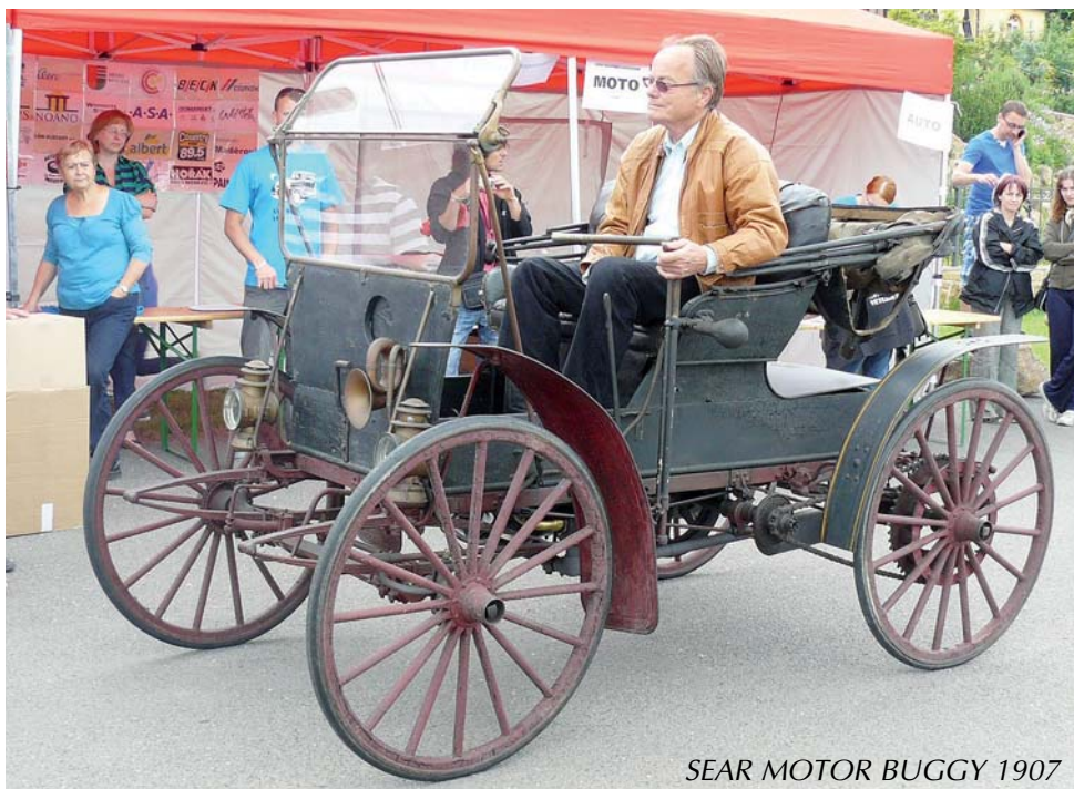
SEAR MOTOR BUGGY 1907

Hned po jeho krátké jezdecké ukázce došlo k vlastnímu odstartování XVI. ročníku a všechna vozidla vyrazila na trať dlouhou něco málo přes 50 km. Posádky změřily síly ve 12 disciplínách, které pro ně byly na trati připraveny. Kromě