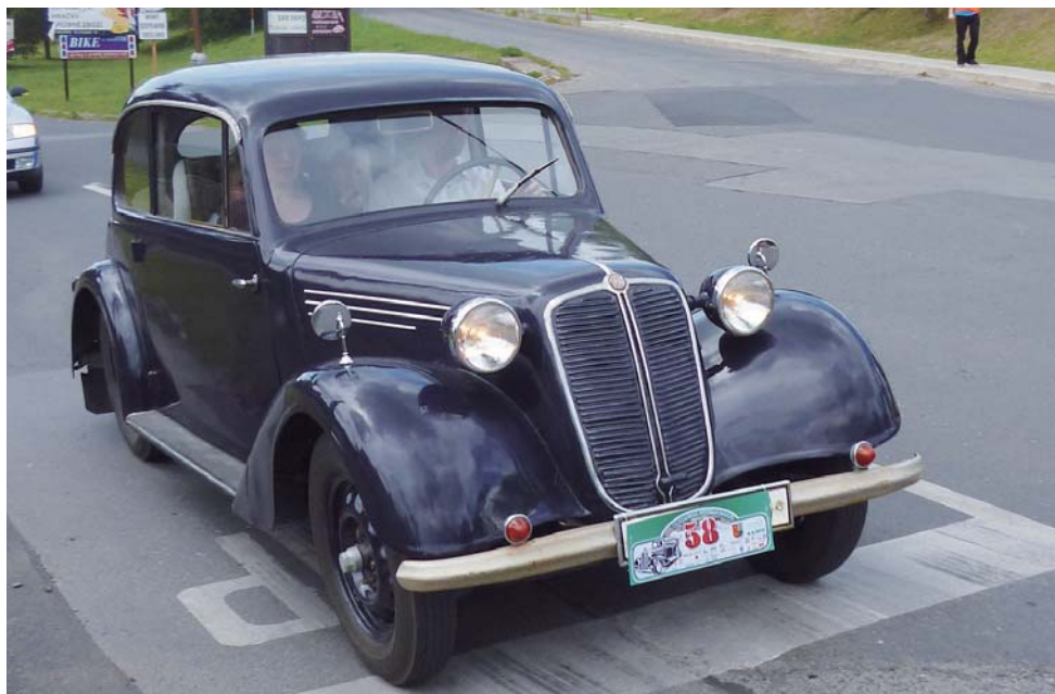
Nejlépe umístěný vůz TATRA...

... pořadatelé určený nejzajímavější automobil