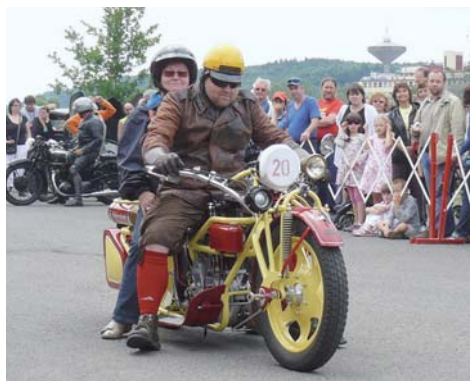
Vítěz v kategorii Motocykl