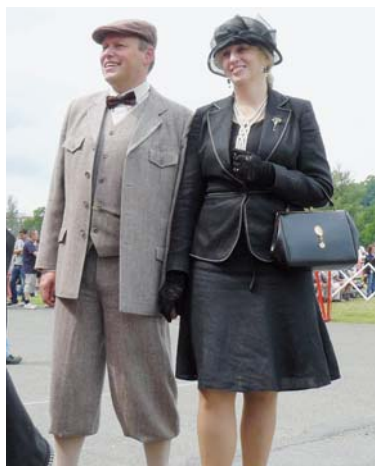
Nejlépe oblečená posádka

Děkujeme všem pořadatelům za zajištění klidného průběhu celé akce, všem partnerům za finanční a materiální pomoc, účastníkům za to, že přijeli s tak krásnými vozidly a všem divákům za podporu akce svou účastí a potleskem.