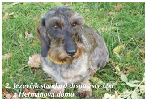
2. Jezevčík standard drsnostý Uxi z Heřmanova domu