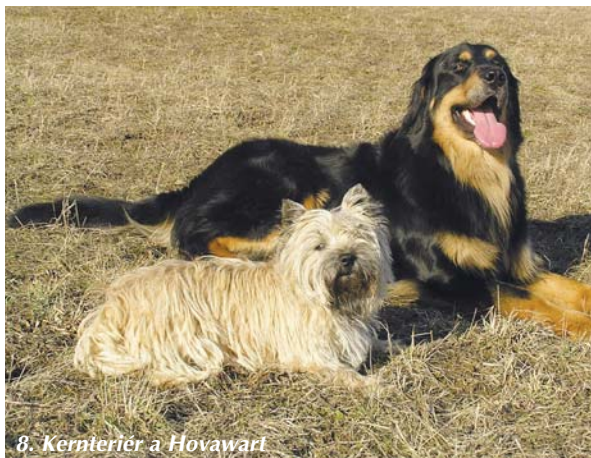
8. Kernterier a Hovawart