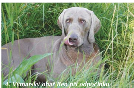
4. Výmarský ohař Ben při odpočinku