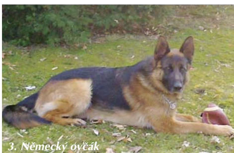
3. Německý ovčák