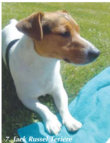
7. Jack Russel Teriére