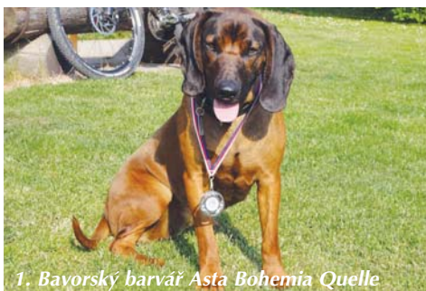
1. Bavorský barvář Asta Bohemia Quelle

Některá plemena psů zanikla a naopak stále vznikají plemena nová. V současné době eviduje Mezinárodní kynologická federace FCI kolem 400 uznaných plemen, která jsou rozdělena podle jejich využití do 10 skupin. V těchto skupinách se, kromě dalších, vyskytují též plemena, která jsou určena pro mysliveckou praxi.