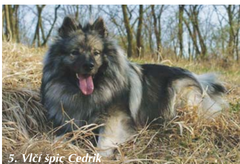
5. Vlčí špic Cedrik